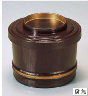
⑥ 1-225-2 A 竹型飯器 溜内朱つば金 ¥1,950 (11.6φ×9.4-内寸10φ×6.3) 種100 420cc 160g