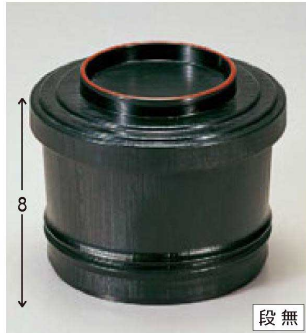
⑤ 1-225-1 A 竹型飯器 グリーン内朱天朱 ¥1,400 (11.6φ×9.4-内寸10φ×6.3) 種100 420cc 160g