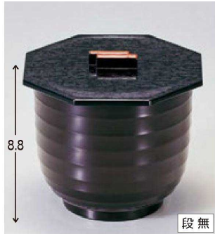
① 1-226-1 A ロクロ目飯器 うるみ ¥1,800 (11.2φ×10.2-内寸9.4φ×7.9) 種100 420cc 126g