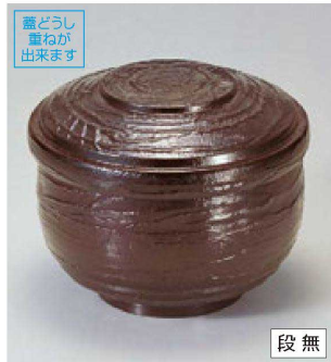
⑭ 1-222-5 A 宝飯器 溜内朱 ¥2,000 (12.2φ×9.5-内寸10.3φ×6.7) 種100 500cc 231g