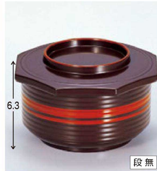
⑫ W-1-92 A 栴質3.6寸浅型線筋飯器 うるみライン内黒塗 ¥2,600 (12.7×11.8×7.5-内寸10.5φ×5.5) 種100 440cc 152g