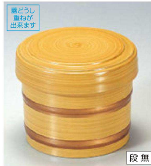
⑪ 1-225-9 A 桶飯器 白木帯金内朱 ¥2,150 (11φ×8.8-内寸9.5φ×7.4) 種100 470cc 138g