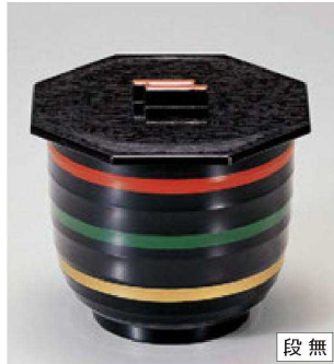
② 1-226-2 A ロクロ目飯器 ロクロ筋 ¥2,000 (11.2φ×10.2-内寸9.4φ×7.9) 種100 420cc 126g