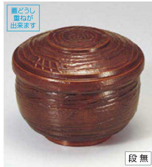
⑮ 1-222-6 A 宝飯器 枋内黒塗 ¥2,400 (12.2φ×9.5-内寸10.3φ×6.7) 種100 500cc 231g