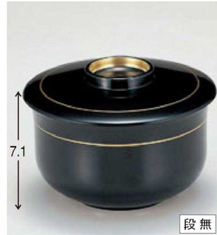
④ 1-228-21 A 百合型飯器 黒金ラインつば金ライン内黒塗 ¥1,450 (12.5φ×8.7-内寸11.1φ×6.3) 種80 560cc 130g