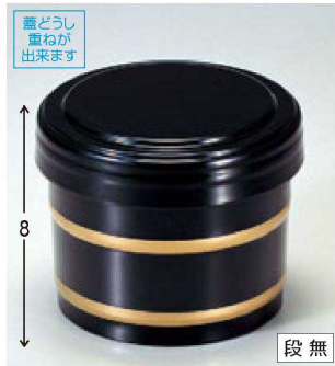
⑨ 1-225-7 A 桶飯器 黒帯金内朱 ¥1,900 (11φ×8.8-内寸9.5φ×7.4) 種100 470cc 138g