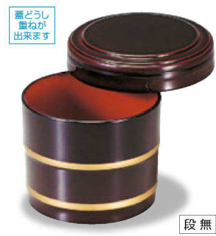
⑩ 1-225-8 A 桶飯器 溜帯金内朱 ¥2,000 (11φ×8.8-内寸9.5φ×7.4) 種100 470cc 138g