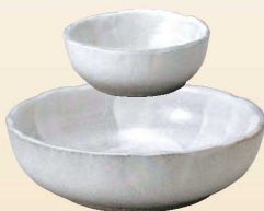
639-4-71J 750円 3.0丸鉢 8.8×3cm 639-5-71J 1,350円 3.5丸鉢 11×4cm 639-6-71J 1,500円 4.0丸鉢 12.2×4.3cm 639-7-71J 2,450円 5.0丸鉢 15.8×5cm 639-8-71J 4,250円 7.0丸鉢 19.8×5.6cm