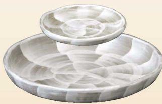
639-9-71J 1,500円 5.0丸皿 14.2×2.2cm 639-10-71J 2,950円 7.0丸皿 20.5×3.7cm 639-11-71J 6,800円 10.0丸皿 26.6×4.3cm