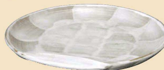
639-32-71J 5,500円 10.0半月皿 27.5×25.5×3cm