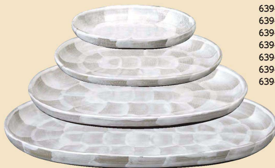
639-21-71J 1,500円 6.0小判皿 17.8×12.3×2.1cm 639-22-71J 1,950円 7.0小判皿 22.8×15.3×1.8cm 639-23-71J 2,600円 8.5小判皿 26.1×17.8×2.2cm 639-24-71J 5,100円 10.0小判皿 30.4×22.5×2.4cm 639-25-71J 5,500円 11.0小判皿 34×25.1×2.5cm 639-26-71J 9,900円 13.0小判皿 39.3×28×2.6cm 639-27-71J 21,000円 15.0小判皿 46.7×31.3×3cm