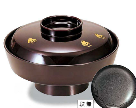
⑫ TM5.5寸天竜寺煮物椀 溜波千鳥見返銀黒波 1-205-12 ¥8,400 (16.5φ×9.7) 椀60 660cc 319g