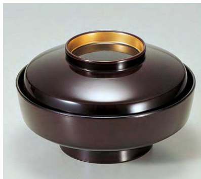
④ TM5寸天竜寺椀 溜つば金 1-205-5 ¥5,200 (15φ×9) 椀60 440cc 263g