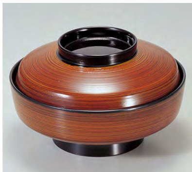
⑤ TM5寸天竜寺椀 春慶刷毛目 1-205-6 ¥5,450 (15φ×9) 椀60 440cc 263g