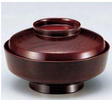
⑧ TM5寸天竜寺椀 古代朱刷毛目 W-11-11 ¥7,500 (15φ×9) 椀60 440cc 263g