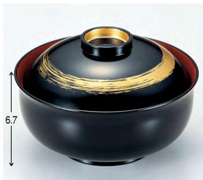
① TA5寸リリー椀 黒内朱一筆つば内金 W-7-11 ¥3,800 (14.8φ×9.6) 椀100 580cc 198g