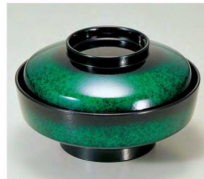
⑥ TM5寸天竜寺椀 アクアグリーン 1-205-7 ¥5,850 (15φ×9) 椀60 440cc