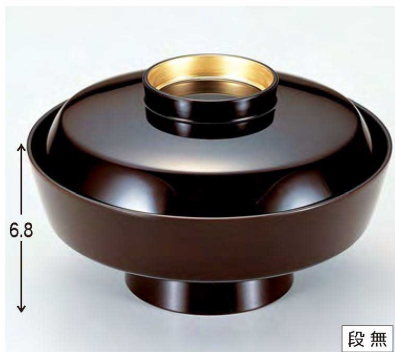
⑪ TM5.5寸天竜寺煮物椀 溜つば金 W-7-13 ¥5,900 (16.5φ×9.7) 椀60 660cc 319g