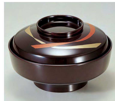
⑨ TM5寸天竜寺椀 溜花帯 1-205-8 ¥6,700 (15φ×9) 椀60 440cc 263g