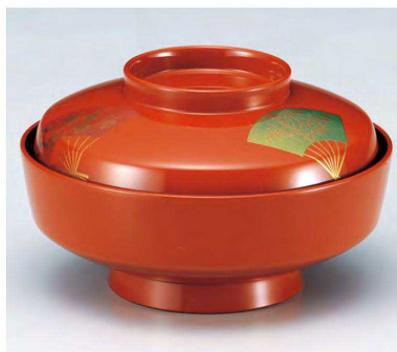
⑩ TM5寸天竜寺椀 朱三色扇面 W-11-12 ¥7,700 (15φ×9) 椀60 440cc 263g