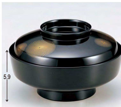
⑦ TM5寸天竜寺椀 黒五輪松 W-11-10 ¥7,500 (15φ×9) 椀60 440cc 263g