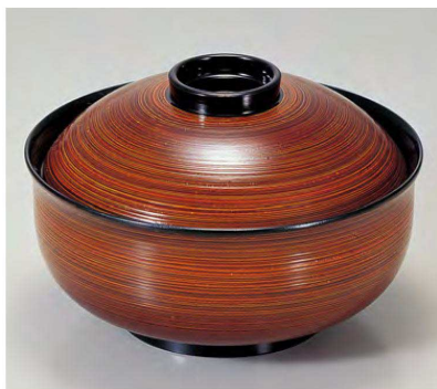
② TA5寸リリー椀 春慶刷毛目 1-202-10 ¥3,900 (14.8φ×9.6) 椀100 580cc 198g