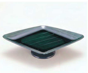
⑮ M-4-32 A 菱形高皿 グリーン刷毛目 ¥2,700 (24.5×17×5.9) 楕60