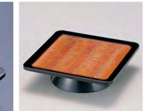
⑯ 1-632-1 A 竹目角高月 春慶洩黒 ¥2,000 (17.8×17.8×5) 楕60