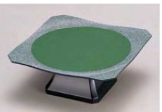
⑨ 1-632-7 A 方面高杯台 グリーン吹雪 ¥2,700 (22.6×22.6×9) 楕40 (有効内寸 φ19.5) 【限定品】