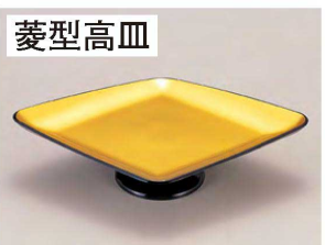
⑫ 1-639-7 A 菱形高皿 黒内金 ¥2,800 (24.5×17×5.9) 楕60