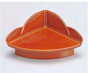
⑭ M-39-38 A 元禄盛器 漆調春慶塗 【限定品】 ¥3,400 (22.8×18.3×8.2) 楕60