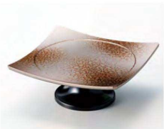
③ M-40-73 TA 平家高月 アンティーク銀溜石目 ¥2,700 (10.5×10.5×3.8) 楕60 (内寸 9φ)(足黒塗)