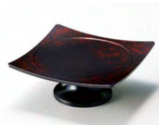
② M-40-72 TA 平家高月 白檀八雲 ¥2,400 (10.5×10.5×3.8) 楕60 (内寸 9φ)(足黒塗)