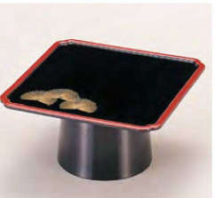
⑰ 1-632-5 A 7寸角三宝 黒若松 ¥2,900 (20.3×20.3×10) 楕50 (コート)

【限定品】 在庫を確認の上ご注文ください。 長時間食材を載せたまま保管する場合は、懐石シート、天紙、フィルムなどをご使用下さい。