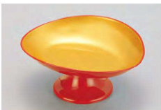
⑥ 1-639-4 A 小判高台盛器 朱内金 ¥2,500 (16.1×14.2×7) 楕60