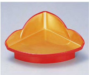
⑬ 1-644-2 A 元禄盛器 金雅洩朱 ¥4,100 (22.8×18.3×8.2) 楕60