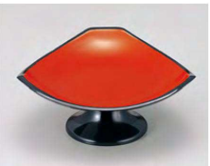
④ 1-639-8 A 高台三角皿 朱洩外黒塗 ¥2,200 (15.7×15.7×6.5) 楕60