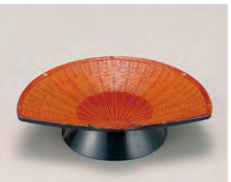
⑤ 1-632-2 A 竹目扇高月 春慶 ¥2,400 (21.5×16.3×5.5) 楕50