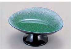
⑦ 1-639-3 A 小判高台盛器 グリーン吹雪 ¥2,400 (16.1×14.2×7) 楕60 【限定品】