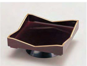
⑪ 1-632-3 A 太閤盛器 溜天金 (高台) ¥2,700 (18.2×18.2×7) 楕50 (内寸 17×17×H2.7/1)