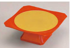
⑧ 1-632-8 A 方面高杯台 朱内金 ¥3,750 (22.6×22.6×9) 楕40