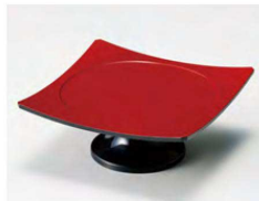
① M-40-71 TA 平家高月 本朱塗 ¥1,300 (10.5×10.5×3.8) 楕60 (内寸 9φ)