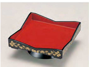
⑩ 1-632-4 A 太閤盛器 黒内朱松竹梅 (高台) ¥3,300 (18.2×18.2×7) 楕50