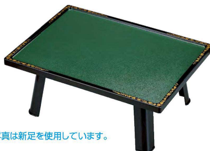
写真は新足を使用しています。

① 大和膳 梨地天唐草 1-22-2 盆のみ ¥9,600 (61.5×45×3.1) 1490g 欄10