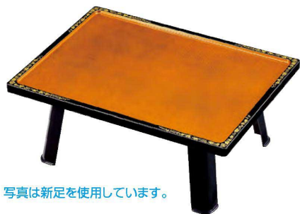
写真は新足を使用しています。

① 大和膳 梨地天唐草 1-22-2 盆のみ ¥9,600 (61.5×45×3.1) 1490g 欄10