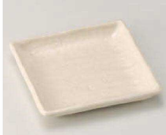
29618-580 白志野銘々皿 820円 100入 (12×12×1.5cm)