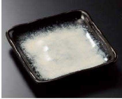
29624-570 雲竜正角中皿 770円 80入 (13.8×13.8×2.7cm)