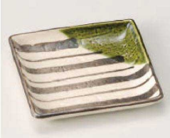
29620-570 織部十草四角皿 800円 120入 (12.3×12.3×1.8cm)