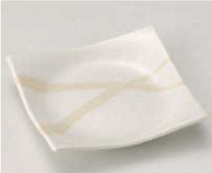
29630-570 白湧水4.5正角皿 580円 90入 (13.7×13.7×3cm)