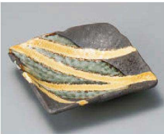
29605-100 乱線白流し縄文小皿 950円 120入 (11×11×3cm)