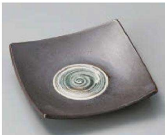
29609-360 錆黒白刷毛銘々皿 880円 60入 (13.5×13.5×2.5cm)