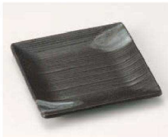
29608-570 白雲正角フルーツ皿 1,100円 62入 (15.3×15.3×1.8cm)