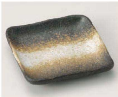
29604-580 京備前正角中皿 980円 100入 (13.9×13.9×2cm)