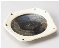
29603-100 和黑ちぎり型 取皿 970円 80入 (16×14.8×2.4cm)