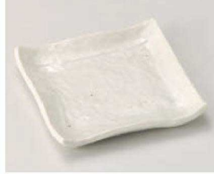
29622-450 白釉正角銘々皿 790円 80入 (12.5×2.2cm)