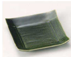
29611-190 織部コヨリ取皿 900円 100入 (12×12×2cm)