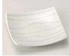
29621-230 青白ライン4.0角皿 860円 100入 (13.5×13.5×2.6cm)