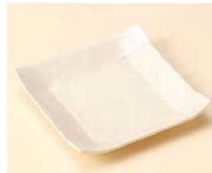
29606-460 乙よりパール取皿 1,000円 80入 (12×12×1.8cm)