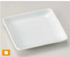
29610-570 白磁正角取皿 1,000円 125入 (11.8×11.8×2.3cm)