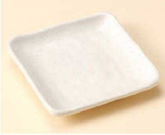
29625-570 粉引正角中皿 770円 80入 (13.8×13.8×2.7cm)