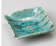
29617-100 緑彩金散らし縄文正角小皿 830円 80入 (11×3cm)