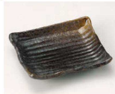
29601-640 琥珀角銘々皿(萬古焼) 1,000円 80入 (13.5×12×3cm)