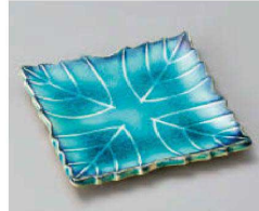
29626-550 トルコ木の葉銘々皿 550円 120入 (11.5×11.5×1cm)