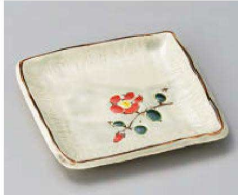
29628-550 椿銘々皿 550円 120入 (11.8×11.8×1cm)