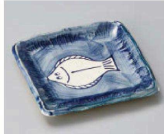
29627-550 ヒラメ銘々皿 550円 120入 (11.8×11.8×1cm)