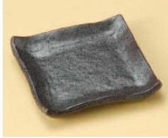
29623-450 黒釉正角銘々皿 790円 80入 (12.5×2.2cm)