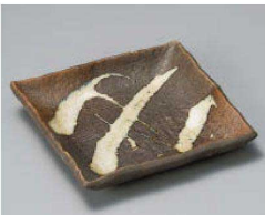
29615-230 なまこ流し角取皿 1,000円 60入 (14.5×13.5×2.2cm)