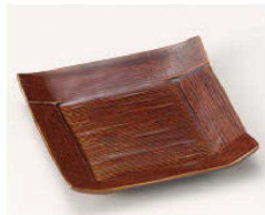
29612-190 あめコヨリ取皿 900円 79入 (12×12×2cm)