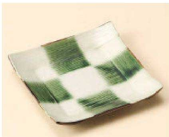
29614-450 織部市松角銘々皿 1,290円 80入 (11.8×2cm)