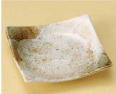
29629-170 雪志野正角4.5皿 600円 120入 (13.7×3.2cm)