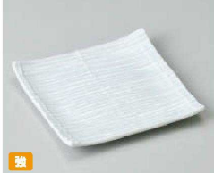
29619-570 青磁スダレ正角銘々皿 940円 100入 (11.7×11.7×1.6cm)