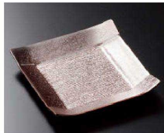
29607-460 乙よりシルバー取皿 1,000円 80入 (12×12×1.8cm)