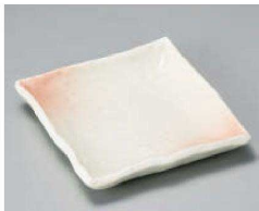
29613-230 ピンク吹くしめ角取皿 1,000円 60入 (14.5×13.5×2.2cm)