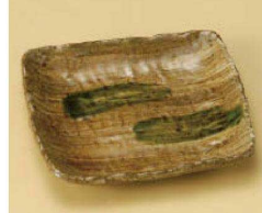
29616-310 黄瀬戸オリベ四角取皿 940円 80入 (15.5×15.5×2cm)