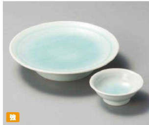
04616-140 青白磁高台6.0皿 5,000円 30入 (19×4.2cm) 04617-140 青白磁高台5.0皿 4,650円 50入 (16×3.8cm) 04618-140 青白磁丸千代口 2,200円 120入 (8.8×3.3cm)