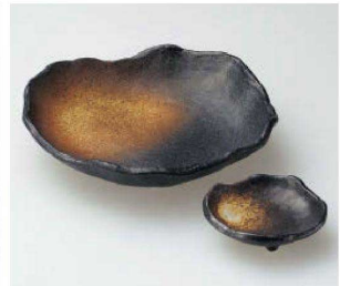
04640-290 黒備前三ツ足刺身皿 2,200円 40入 (20×19×4.8cm) 04641-290 黒備前三ツ足千代口 550円 180入 (9×9×2.9cm)