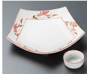
04621-140 朱呉須花絵五角皿(大) 4,500円 40入 (23.5×23.5×4.5cm) 04622-140 朱呉須花絵五角皿(小) 2,800円 60入 (16×16×3.5cm) 04623-140 朱巻丸千代口 1,100円 200入 (6.5×3cm)