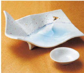
04619-140 折り紙ラスター皿 4,850円 30入 (23.5×17×8.5cm) 04620-140 ラスター一反千代口 1,400円 150入 (8.5×2.3cm)