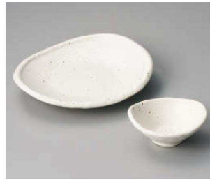
04630-190 白マットたまご型皿 1,500円 60入 (18.7×16.5×3.5cm) 04631-190 白マットしずく小付 500円 150入 (9.5×8.5×4cm)