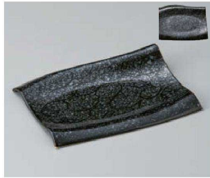
04609-170 瓦型 銀砂しゃぼん向付 5,300円 (25×19×3.5cm)