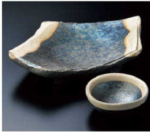
04610-660 黒窯変掛け分け変型足付皿(信楽焼) 5,200円 30入 (19.5×13×5cm) 04611-660 黒窯変掛け分け千代口(信楽焼) 1,100円 200入 (7.5×3cm)