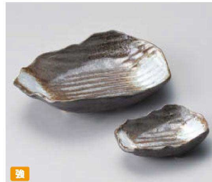
04638-550 白吹黒水晶岩型刺身鉢 2,250円 30入 (19.5×14×4.5cm) 04639-550 白吹黒水晶岩型千代久 900円 100入 (11×8×3cm)