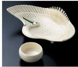
04605-430 高らいツル向付 5,300円 40入 (20.8×13.8×5.3cm) 04606-430 高らい丸のぞき 630円 300入 (5.6×3.2cm)