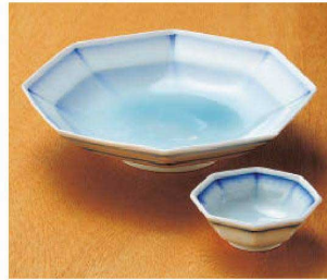
04612-140 藍流し八角皿 5,000円 40入 (20.3×19.5×4.7cm) 04613-140 藍流し八角千代口 2,200円 100入 (8.5×8×3.2cm)