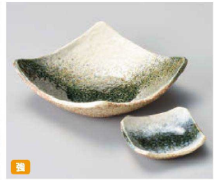
04632-550 緑川ひし形7.0鉢 3,050円 40入 (21.3×19.8×5.4cm) 04633-550 緑川正角皿 850円 150入 (8.6×8.6×2.4cm)