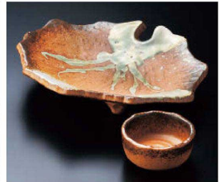
04624-310 信楽風木の葉刺身皿 4,400円 30入 (20.2×18.5×4.4cm) 04625-310 信楽風木の葉千代口 1,200円 150入 (6.8×3.2cm)