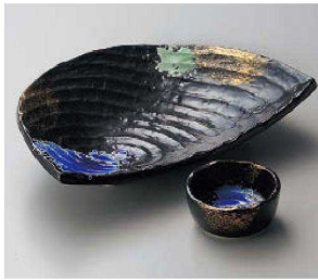
04603-170 黒釉三色吹半月向付 5,650円 40入 (22×15.5×5cm) 04604-170 黒釉三色吹千代久 1,870円 150入 (6.7×3cm)