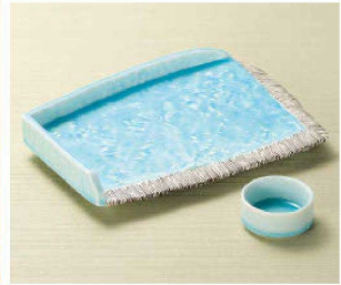
04614-140 湖水屏風型変形皿 5,000円 20入 (27×18.3×4.3cm) 04615-140 湖水青白千代口 1,450円 150入 (6.7×3cm)