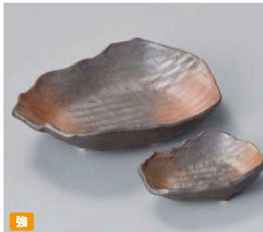
04636-580 火色岩型刺身鉢 2,250円 40入 (19.5×14×4.5cm) 04637-580 火色岩型千代久 890円 120入 (11×6×3cm)