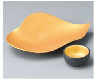
04607-460 鉄結晶(ゴールド)山型向付 5,500円 (22×13.5×5.8cm) 04608-460 ゴールド千代口 2,000円 (6.3×3.3cm)