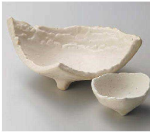
04628-020 桃山21cm三角鉢 3,250円 40入 (20.7×16×8cm) 04629-020 桃山8.5cm三ツ足小付 1,100円 150入 (8.5×8×4.3cm)