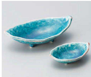
04634-130 紺彩葉型向付 2,400円 60入 (20.3×11×6.5cm) 04635-130 紺彩葉型千代久 1,200円 100入 (11.8×7.5×3.8cm)