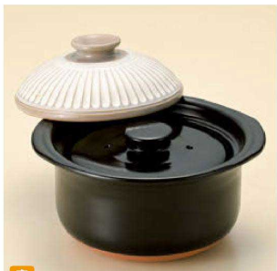
直 52608-650 銀峯菊花粉引ご飯釜5合炊(中蓋付)(萬古焼) 4人 (26×26×17cm・身12.3cm) 18,500円 52609-650 銀峯菊花粉引ご飯釜3合炊(中蓋付)(萬古焼) 13,500円 6人 (24.7×22.5×16cm・身10.5cm) 52610-650 銀峯菊花粉引ご飯釜2合炊(中蓋付)(萬古焼) 9,000円 8人 (21.5×19.3×15cm・身10.3cm)