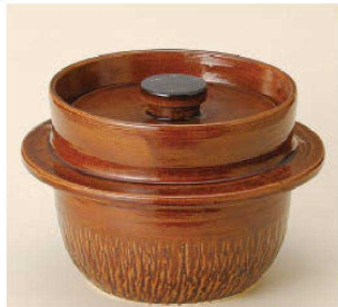
直 手造り 52601-650 アメ釉手造りご飯釜3合炊(萬古焼) 4人 (25×25×16cm・口径20.5cm) 35,000円