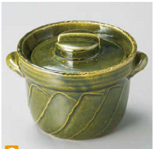
直 52623-640 織部捻れごはん鍋(1合炊)(萬古焼) 6,500円 (17×14.5×11.5cm)