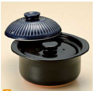
直 52611-650 銀峯菊花ルリご飯釜5合炊(中蓋付)(萬古焼) 18,500円 4人 (26×26×17cm・身12.3cm) 52612-650 銀峯菊花ルリご飯釜3合炊(中蓋付)(萬古焼) 13,500円 6人 (24.7×22.5×16cm・身10.5cm) 52613-650 銀峯菊花ルリご飯釜2合炊(中蓋付)(萬古焼) 9,000円 8人 (21.5×19.3×15cm・身10.3cm)