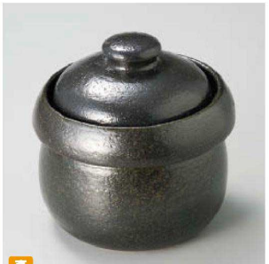
直 52604-650 黒釉壺型ごはん鍋1合炊(萬古焼) 12人 (15×15cm・900cc) ※身11.5cm 52605-650 黒釉壺型ごはん鍋2合炊(萬古焼) 12,000円 8人 (17×16cm・1,300cc) ※身12.5cm