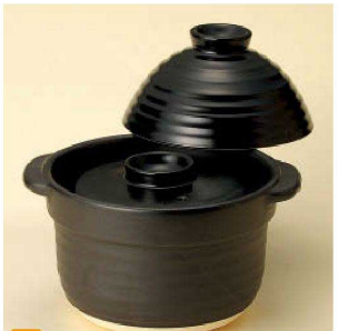
直 52632-470 ごはん炊きブラック2合炊き 7,300円 16人 (20.5×16.5×16.3cm) 52633-470 ごはん炊きブラック1合炊き 4,800円 20人 (16.5×13.5×14.5cm)