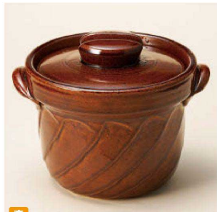
直 52617-650 アメ釉捻りご飯釜5合炊(萬古焼) 16,000円 4人 (26×23×20cm) ※身18cm 52618-650 アメ釉捻りご飯釜3合炊(萬古焼) 13,500円 6人 (23×19.8×17cm) ※身14.8cm 52619-650 アメ釉捻りご飯釜2合炊(萬古焼) 10,000円 8人 (20.5×17×15cm) ※身12.8cm 52620-650 アメ釉捻りご飯釜1合炊(萬古焼) 7,200円 16人 (17×14.5×11cm)