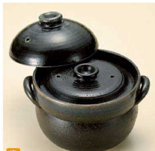
直 52606-650 るり釉ご飯釜4合炊(中蓋付)(萬古焼) 6人 (25×21×18.5cm・身14cm) 18,000円 52607-650 るり釉ご飯釜2合炊(中蓋付)(萬古焼) 12,500円 8人 (20.5×17.5×16.5cm・身11.5cm)