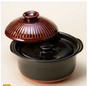
直 52614-650 銀峯菊花アメご飯釜5合炊(中蓋付)(萬古焼) 18,500円 4人 (26×26×17cm) ※身12.3cm 52615-650 銀峯菊花アメご飯釜3合炊(中蓋付)(萬古焼) 13,500円 6人 (24.7×22.5×16cm) ※身10.5cm 52616-650 銀峯菊花アメご飯釜2合炊(中蓋付)(萬古焼) 9,000円 8人 (21.5×19.3×15cm) ※身10.3cm