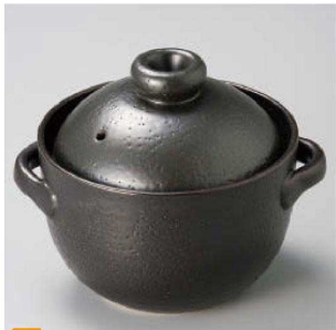
直 52629-Y0 黒モダンご飯釜2合炊(中蓋付)(萬古焼) 12,000円 8人 (21×17.3×16cm・身11cm) 52630-Y0 黒モダンご飯釜3合炊(中蓋付)(萬古焼) 15,000円 6人 (23×19.5×17.5cm・身12cm)