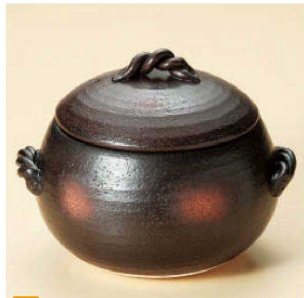
直 52626-640 黒丸ごはん鍋(大)7合炊(萬古焼) 13,000円 6人 (28×24×21cm・身14.5cm・4,200cc) 52627-640 黒丸ごはん鍋(中)5合炊(萬古焼) 9,600円 8人 (24×21×17.5cm・身12.5cm・2,500cc) 52628-640 黒丸ごはん鍋(小)3合炊(萬古焼) 6,800円 12人 (21×18×16.5cm・身11.5cm・2,000cc)