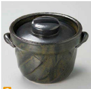
直 52621-640 黒釉捻れごはん鍋(2合炊)(萬古焼) 10,000円 (20×16.8×14.3cm) 52622-640 黒釉捻れごはん鍋(1合炊)(萬古焼) 7,200円 (17×14.5×11.5cm)