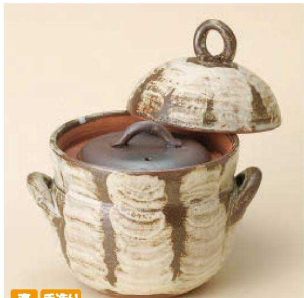
直 手造り 52602-650 唐津刷毛目ご飯釜2合炊(中蓋付)(萬古焼) 8人 (22.5×16.5×20cm・身13.7cm) 15,000円