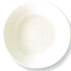
白粉引 RI80皿 φ24×3.5cm GSKRI80 ¥2,180