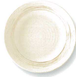
刷毛粉引 RI80皿 φ24×3.5cm HKERI80 ¥2,680