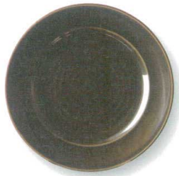
織部 RI80皿 φ24×3.5cm GOLRI80 ¥2,180