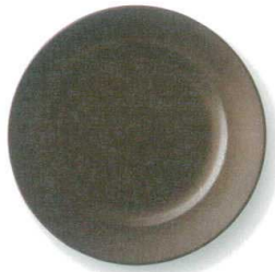
黒茶 RI80皿 φ24×3.5cm GKTRI80 ¥2,180