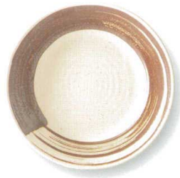
錆刷毛 RI80皿 φ24×3.5cm SAHRI80 ¥2,680