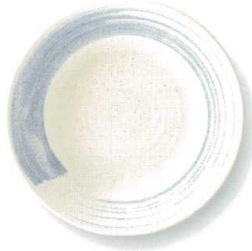
呉須刷毛 RI80皿 φ24×3.5cm GOHRI80 ¥2,680