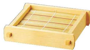
檜・ざるセイロ 21-284-09(18209) ¥7,200 22×21.8×H5cm ※竹スタレ(17×17cm)付 ※本体塗装付