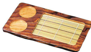
焼杉葉味付もり(N-83) 21-284-05(19104) ¥6,950 32×18(穴径φ6.8)cm ※竹スタレ(17.8×12cm)付 ※本体塗装付