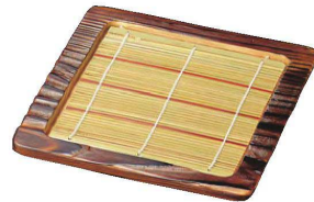
焼杉正角ざる(N-85) 21-284-03(19102) ¥6,400 23×22cm ※竹スタレ(17×17cm)付 ※本体塗装付