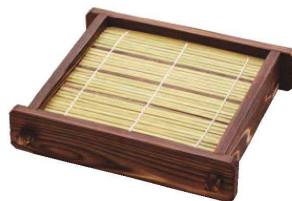
焼杉ざるセイロ(N-112) 21-284-08(18241) ¥5,150 22×21.8×H5cm ※竹スタレ(17×17cm)付 ※本体塗装付