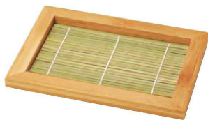
竹・板そばプレート(長角) 21-284-01(21664) ¥3,350 22×16×H2cm ※竹スタレ(18×12cm)付 ※本体塗装付