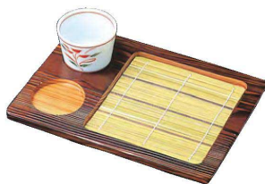
焼杉葉味付ざる(N-84) 21-284-04(19103) ¥7,600 30×22(穴径φ6.8)cm ※竹スタレ(17×17cm)付 ※本体塗装付 ※そば千代口はイメージ