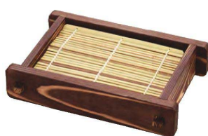
焼杉もりセイロ(N-111) 21-284-07(18240) ¥5,000 24×17×H5cm ※竹スタレ(17.8×12cm)付 ※本体塗装付