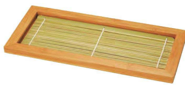
竹・板そばプレート(ロング) 21-284-02(21667) ¥5,220 35×16×H2cm ※竹スタレ(31×11.8cm)付 ※本体塗装付