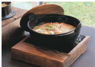
▶ P1157 EBM IH調理器用木枠 ▶ P1778 鉄田舎鍋