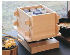
▶ P935 角セイロ ▶ P1157 EBM IH調理器用木枠