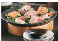
▶ P1160 丸太ディスプレイ台