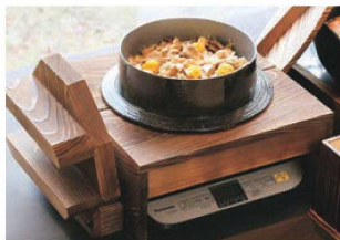
▶ P1158 電磁調理器用ごはん釜