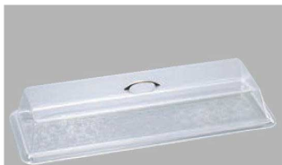
ネオスタンダードカバー-926 組み合わせ シャロートレー-926