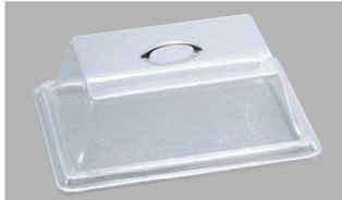
スタンダードカバー-1318 組み合わせ シャロートレー-1318