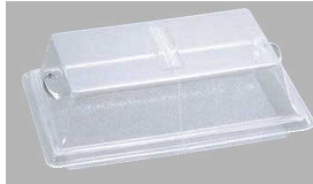
センターヒンジカバー-1218 組み合わせ シャロートレー-1218