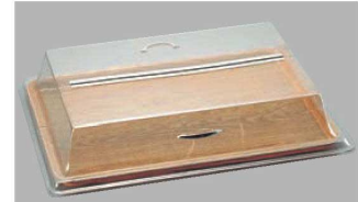
ロングセンターヒンジカバー-1826 組み合わせ カムトレイ-1826/ライトエルム