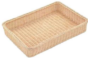
①大型籐かご ㊦ ページコード 商品コード 価格 P-4 6-1078-0101 4769000 ¥6,000 外寸:500×350×H90