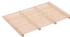
⑤籐製 スカシスノコ ページコード 外寸 商品コード 価格 16-838A 6-1078-0501 400×300×H30 5359700 ¥5,300 16-838B 6-1078-0502 600×400×H30 5359800 ¥8,000