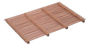
⑥籐製 スカシスノコ 茶 ページコード 商品コード 価格 16-839A 6-1078-0601 5359900 ¥5,300 外寸:400×300×H30