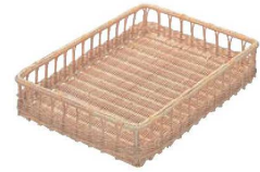
③籐製 大型パンカゴ ㊦ ページコード 商品コード 価格 DR-102 6-1078-0301 7016500 ¥9,200 外寸:350×500×H90 鉄芯入りの堅牢仕上