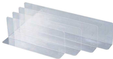
⑨PS仕切板 ㊦ ページコード 外寸 商品コード 価格 30662 6-1078-0901 270×50×H100 3814700 ¥150 30663 6-1078-0902 320×50×H100 3814710 ¥160 30664 6-1078-0903 370×50×H100 3814720 ¥200 30665 6-1078-0904 420×50×H100 3814730 ¥210 30666 6-1078-0905 270×75×H150 3814740 ¥190 30667 6-1078-0906 320×75×H150 3814750 ¥200 30668 6-1078-0907 370×75×H150 3814760 ¥270 30669 6-1078-0908 420×75×H150 3814770 ¥290 30671 6-1078-0909 370×100×H200 3814780 ¥330 30672 6-1078-0910 420×100×H200 3814790 ¥360