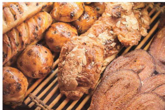
ページコード 外寸 商品コード 価格 (7)16-716W 6-1078-0701 100×350×H60 5360100 ¥3,300 (8)16-729 背高 6-1078-0801 80×300×H80 5360200 ¥2,300