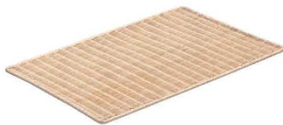
④籐製 パンスノコ ㊦ ページコード 外寸 商品コード 価格 25N 6-1078-0401 400×300 5136700 ¥3,800 54N 6-1078-0402 500×400 7016200 ¥6,200 5N 6-1078-0403 600×400 5136600 ¥7,000 75N 6-1078-0404 750×400 7016300 ¥9,200 9N 6-1078-0405 900×400 5136500 ¥9,500