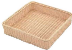
②大型籐かご ㊦ ページコード 商品コード 価格 P-3 6-1078-0201 4768900 ¥5,200 外寸:400×400×H90