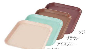
⑯ PPトレイ 正角