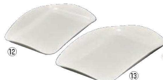
⑫ ニューウェーブトレイ