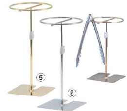
⑤ トングスタンド(伸縮式)Ⅲ型