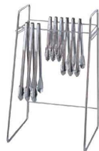
③ EBM 18-8 トングスタンド