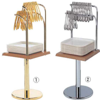
① シンプルセルフスタンド