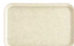
⑮ ザ・セールストレイ