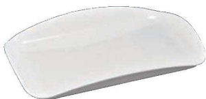
⑭ ニューウェーブセルフ セールストレイ