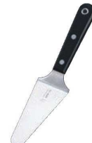
㉒ステンレス黒合板 パイサーバー