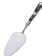
⑰ロイヤル ケーキサーバー