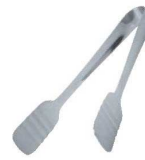
⑧リス 18-0 ケーキトング 特大