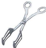
②マトファー チョコレートトング