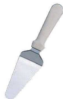
⑱ベガス PC柄 ケーキサーバー