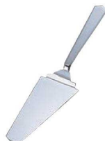
⑯ピアツァ 18-10 パイサーバー