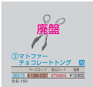
③マトファー チョコレートトング