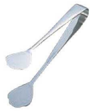
⑥TH 18-0 厚手ケーキトング