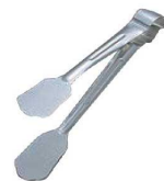
④18-8 抗菌 サービスケーキトング