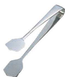
⑤TH 18-8 ケーキトング