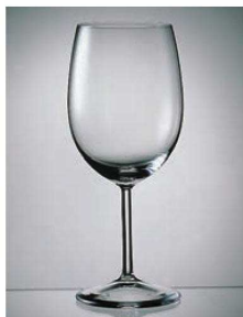
⑨ グラン・ボルドー 洗 MX2809/00 (6個入) 瓶 ページコード 商品コード 価格 6-1512-0901 7235501 ¥7,500 φ70×M86×H208 450cc