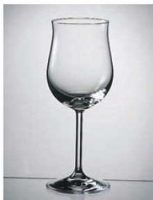
⑩ エルミターージュ・赤タイプ 洗 MX2809/22 (6個入) 瓶 ページコード 商品コード 価格 6-1512-1001 7236301 ¥7,200 φ63×M74×H185 240cc