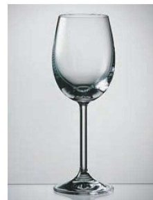
⑪ リキユールグラス 洗 MX2809/05 細 (6個入) 瓶 ページコード 商品コード 価格 6-1512-1101 7237201 ¥5,400 φ54×H135 60cc

●このカタログに掲載されている価格は、2026年6月1日現在のものです。税抜価格です。 ●価格・仕様は予告なしに変更する場合があります。予めご了承ください。