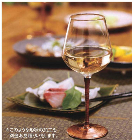
※このような形状の加工も 別途お見積りいたします。

漆器の伝統技術と現代技術の統合により グラスウェアにうるしを加飾した商品が実現。 伝統的なうるしの繊細さや優雅さを持ちつつ、 特別な空間を唯一無二の食器で演出致します。