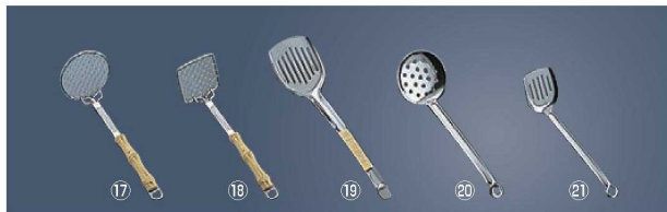
18-8 夕華 湯ドーフアミ杓子