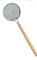
㉒EBM 木柄 万能すくい