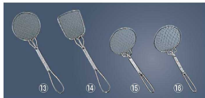
湯ドーフアミ杓子