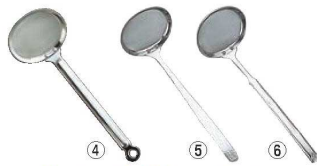
④18-8 食道楽 あく取り