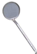
⑧AG 18-8 レードル柄 あく取り