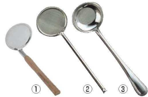
①EBM ウォールナット柄 あく取り