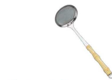
⑦18-8 夕華 あく取り