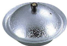
⑧アルミ みぞれ鍋 銀河