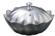
⑦しぐれ鍋 小菊 蓋付