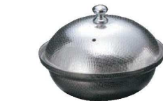
⑤しぐれ鍋 小丸 蓋付