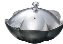
⑥しぐれ鍋 小梅 蓋付