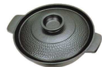
⑩アルミ 植目入 寄せ鍋