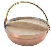
⑭銅 段付ツル付鍋 (木蓋付) 1人用