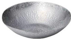
③新亀甲鍋 ステンレス