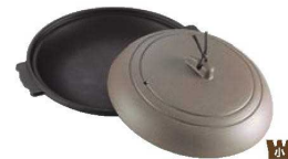
⑮アルミ 丸型 陶板焼 素焼き茶