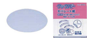
⑳クックパー 業務用 セバレート紙 丸型