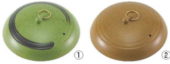
アルミ 陶板焼 蓋