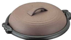
⑯アルミ 陶板焼 素焼き茶