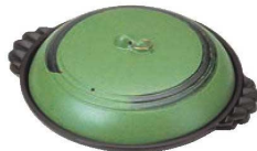
⑰アルミ ジャンボ 陶板焼 ありそ

●大型サイズの陶板で、盛皿としても使用できます。 ●皿はフッ素3層コーティングで耐久性に優れています。