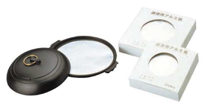
㉒調理用 アルミ箔 (500枚入)