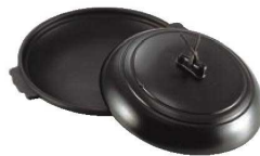
⑭アルミ 丸型 陶板焼 黒