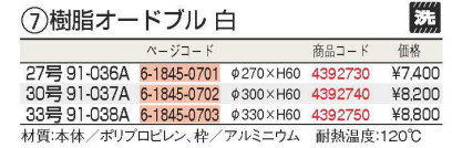
⑦ 樹脂オードブル 白