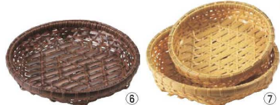
⑥ 樹脂オードブル 茶

Check! ●④～⑤は ●竹製と同じように手作りで仕上げたので天然素材の風合いを残しています。 ●衛生面、耐久性に優れています。