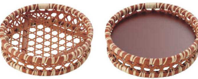
⑬ 樹脂 六ツ目オードブル 茜