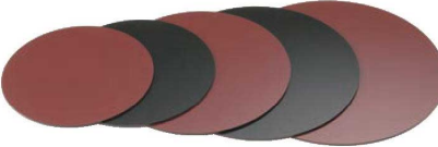
⑭ 樹脂 塗り板