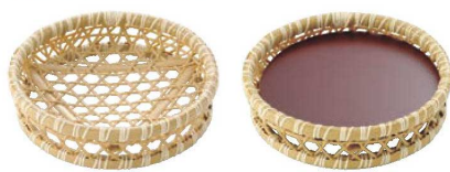
⑫ 樹脂 六ツ目オードブル 白