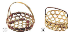
竹つる付珍味入れ