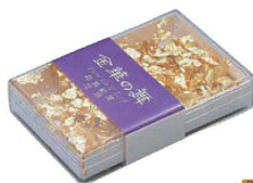
⑳ 金箔 64238 金華の舞 軽減税率