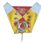
⑥ 鯛のしちり巻 No.6032-2 (100枚入)