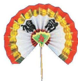
④ 花楊枝 福扇 700 (K) (100入) 中