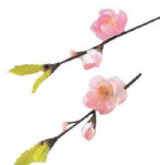
⑮ 飾り花 (100入) 梅