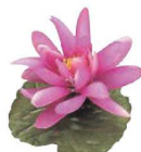
⑱ 飾り花 (100入) ハス