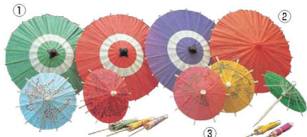
① 蛇ノ目傘 B (100ヶ入)