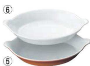
小判 耳付 グラタン皿 (無地) No.603