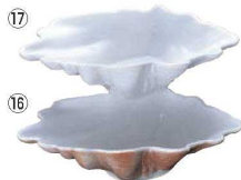
トロピカルシェル深型 No.180