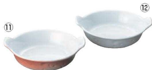
深型 丸耳付 グラタン皿 No.610