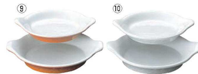
浅型 丸耳付 グラタン皿 No.605