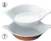
丸 耳付 グラタン皿 (無地) No.602