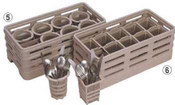
⑤レーバン カトラリーラック ㉗ ㉘