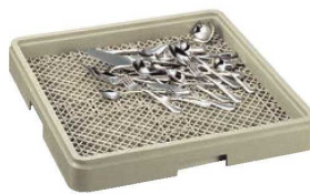
②シルバーラック フルサイズ ㉗