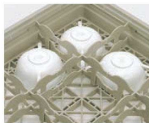
④カップラック フルサイズ デミタス・ブイオン用 ㉗ ㉘