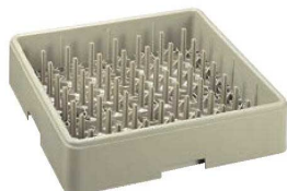
①プレート・トレイラック フルサイズ ㉗