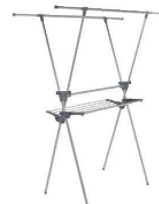
⑥セキスイ ステンレスものほしスタンド STM-1002 ㊦

外寸:700×560×H720 重量:1.32kg 材質:本体/スチールパイプ(粉体塗装) 樹脂部品/ポリプロピレン 金属部品/スチール(メッキ) ●バスタオル4枚、フェイスタオル3枚が干せます。