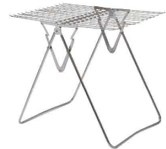
⑨物干し ウィング ㊦

外寸:455×715×H680 材質:スチールクロムメッキ ●系ラゲなら32枚、タオルなら18枚干せます。 片側だけの使用もできます。