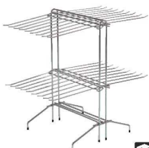
⑧コンドル系ラゲ掛け FU363 ㊦

材質:スチールクロムメッキ ●折りたたみ式 ●タオルが大は28枚、小は11枚干せます。