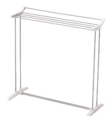
⑩バスタオルスタンド PS-22 ㊦

材質:スチールクロムメッキ ●折りたたみ式 ●タオルが大は28枚、小は20枚干せます。