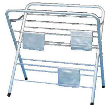
③雑巾掛 X型 ㊦

外寸:550×470×H690 材質:スチールアクリル焼付 ●雑巾24枚掛 折りたたみ式