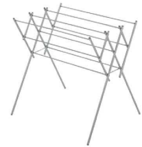
④セキスイ 室内用ものほし台 DS-150W ㊦