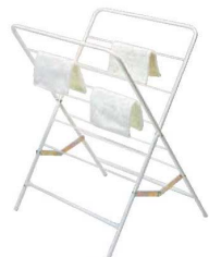
②コンドルハンガーD 雑巾掛 C-43 ㊦

外寸:423×787×H728 材質:スチールクロムメッキ ●タオル32枚掛、折りたたみ式で片側だけの使用もできます。