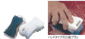
⑳ タイル& マナ板用 カラーブラシ 2000 ブルー

使いたいだけ、ハサミで切って使える便利な磨きブラシ。ペースがやわらかいので凹凸のある場所でもご使用できます。