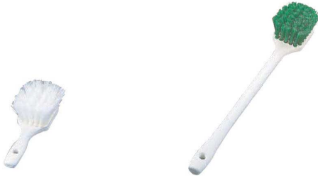
カラーハンドブラシ 8.5インチ 1299