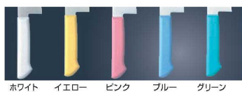
ホワイト イエロー ピンク ブルー グリーン