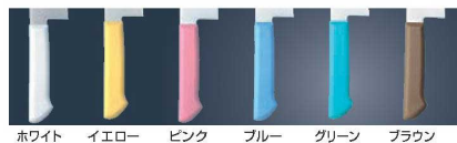
ホワイト イエロー ピンク ブルー グリーン ブラウン