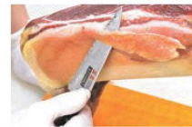
⑬ 正広作 生ハム トリミングナイフ 画 加