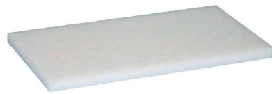
③リス 業務用プラスチック まな板 (両面シボ付) 耐熱 70c

●シボ付(エンボス加工)により滑り止め効果と水切れが良くなります。 ※特注サイズ承ります。