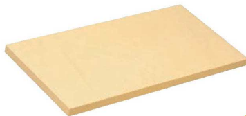
EVA樹脂 ハイソフトまな板 耐熱 70c

従来のまな板よりやわらかく弾力性がある為、連続使用でも疲労感が少なく、庖丁をいためません。