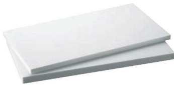
②リス 業務用抗菌プラスチック まな板 (両面シボ付) 耐熱 70c

●熱風式まな板消毒保管庫に対応可能 ●耐熱樹脂製で沸騰水の溜しげ消毒もできます。 ※熱風保管庫でご使用の場合は、厚さ30mmタイプを推奨します。 ※特注サイズ承ります。