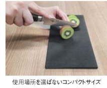
使用場所を選ばないコンパクトサイズ

●このカタログに掲載されている価格は、2026年6月1日現在のものです。税抜価格です。 ●価格・仕様は予告なしに変更する場合があります。予めご了承ください。