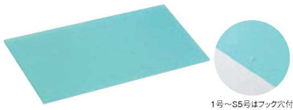
1号～S5号はフック穴付