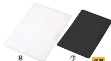
⑭ 両面使える柔らかシートまな板

外寸:190×270×H4 材質:シリコンゴム ●抗菌剤を刻み込んだシリコンを使用しております。一体成型で清潔を保てる抗菌カッティングボードです。材質は日本製の高級シリコンゴムを使っております。