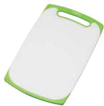
① トンボ ラバー付 耐熱抗菌まな板