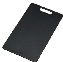
⑤ 見やすい耐熱抗菌まな板 ライトブラック

材質:本体/ポリプロピレン、ラバー部/熱可塑性エラストマー ●ラバー付きです。べルにくいです。 ●汁漏れ防止の溝付きです。 ●抗菌加工(SIAA抗菌適合)