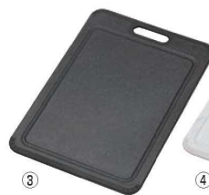
③ トンボ NEWラバー付ワイドまな板

材質:本体/ポリプロピレン、ラバー部/熱可塑性エラストマー ●両面ミソ付きでおこしやすです。 ●ラバー付きで滑りにくいです。