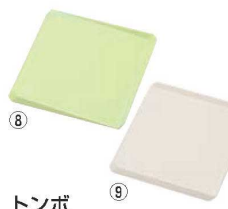
⑧ トンボ 環境にやさしいまな板 フルーツパレット S

材質:セルロースパルプ ●木を主原料にした環境に優しいまな板です。 ●水切れがよいので衛生的で洗いがしやすいです。 ●耐久性も高いので食材の色や臭いもつきにくい。