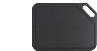
ケヴンハウ ウッドファイバーカッティングボード ブラック