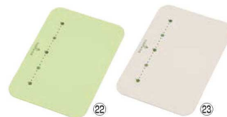
⑳ トンボ 環境にやさしいまな板 フルーツパレット M