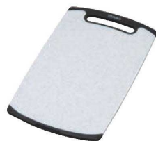
② トンボ おこしやすいらバー付 耐熱抗菌まな板 石目調

材質:ポリプロピレン/熱可塑性エラストマー ●ラバーの滑り止め付きです。 ●両面使用可能です。