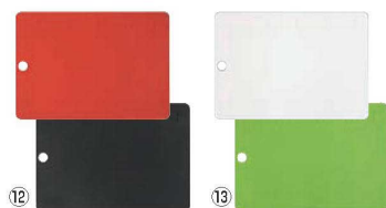
ヴィヴ シリコン抗菌 カッティングボード 190×270mm

材質:熱可塑性ポリウレタン系エラストマー ●キズがつきにくいエラストマー素材です。 ●調理台のフチに沿って置けるD型です。