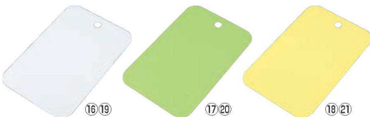
⑯ トンボ スイーツシートS