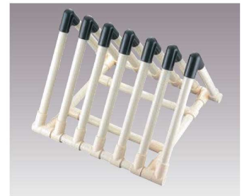
⑧EBM イレクター まな板スタンド 別 ページコード 商品コード 価格 6-0357-0801 8381000 ¥39,000 外寸:430×455×H340 ●厚さ35mmまでのまな板が6枚立てられます。