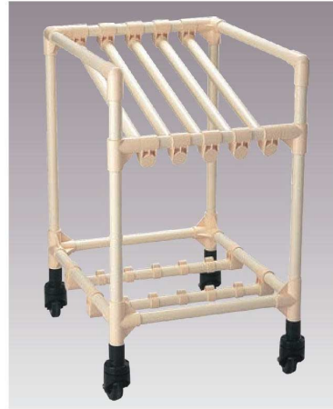
②EBM イレクター まな板ドローリー 別梱包 ページコード 商品コード 価格 6-0357-0201 8380900 ¥66,000 外寸:530×450×H750 キャスターφ65×4輪自在 有効内寸:460 ●厚さ35mmまでのまな板が6枚立てられます。