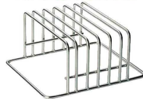
④EBM 18-8 まな板立 (極太φ10mm) ページコード 商品コード 価格 6-0357-0401 3556500 ¥25,000 外寸:400×340×H195 20mm…2枚 30mm…4枚 計6枚