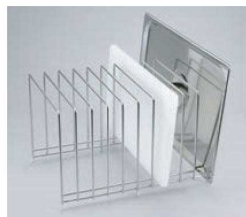
③EBM 18-8 G/Nハンカパー& まな板スタンド ページコード 商品コード 価格 6-0357-0301 3603500 ¥14,000 外寸:420×270×H270 ●まな板、500×270×厚さ30mmまでのものが10枚まで収納できます。