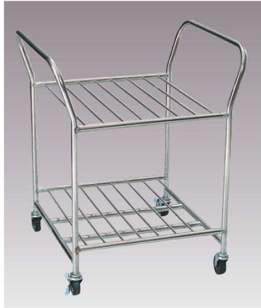
①EBM 18-8 まな板立 ドローリー 別梱包 ページコード 商品コード 価格 6-0357-0101 6056610 ¥98,000 外寸:575×515×H700 キャスターφ65×4(自在ストッパー2ヶ付) 材質:18-8ステンレス 有効内寸:400 ●厚さ40mmまでのまな板が7枚立てられます。