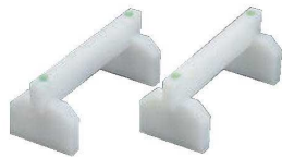
①EBM まな板用脚 (2ヶ1組)