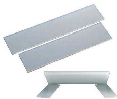
⑨まな板スベリ止用 シリコンマット (2枚組)