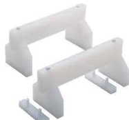
②住友 プラスチック 高さ調整式 まな板用足 (2ヶ1組)