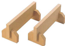
⑤ニュー-抗菌 まな板用脚 (2ヶ1組)