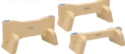
⑦抗菌 まな板 リフター (1本)