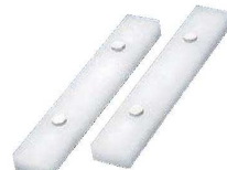
③住友 プラスチック まな板受け台 (2本1組)

※H160は高さ調整ブロックが付いています。H180は20mm、H200は40mmの高さ調整ブロックが、それぞれ付属されています。ご注文の際は、H160、H180、H200をご指定ください。