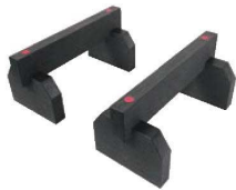
④抗菌アルファボード まな板用脚 (2ヶ1組) ブラック