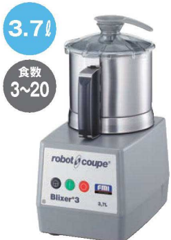
①ロボクーブ BLIXER-3D 6-0371-0101 5512000 ¥360,000