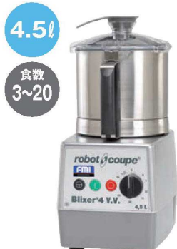
②ロボクーブ BLIXER 4V.V.B 6-0371-0201 1014370 ¥460,000