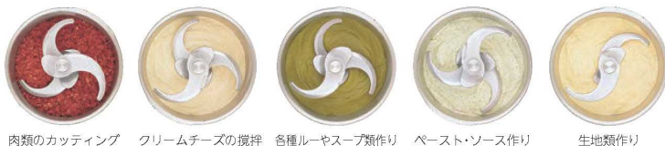
肉類のカッティング クリームチーズの攪拌 各種ルーやスープ類作り パースト・ソース作り 生地類作り