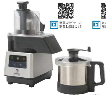
③ エレクトロラックス トリニティプロ コンビカッタースライサー