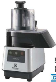
① エレクトロラックス トリニティプロ 野菜スライサー