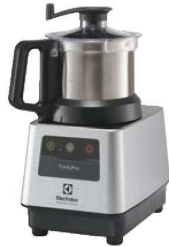
② エレクトロラックス トリニティプロ カッターミキサー