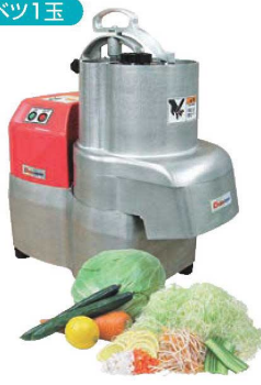
④ ハッピーマルチャー