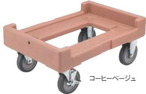
コーヒーベージュ