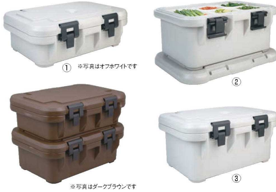
① ※写真はオフホワイトです