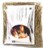
⑥乾燥フラ(薫焼き用) 約500g 画B