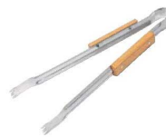
⑬網もつかめるトンガ