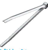
⑫エコクリーン 18-0 厚口炭バサミ 画D 画E