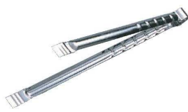
⑨ステンレス 火バサミ