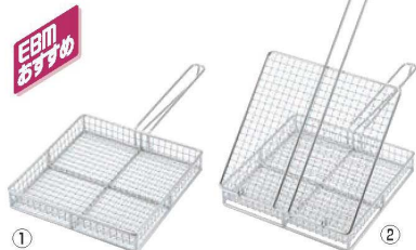
EBM 18-8 炭火やきとりカゴ