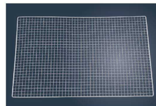
④キャンプグロースター