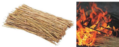
⑤国産わら フラ焼き用(約500g×20袋入) 画A