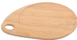
⑪ラバーウッド ピザプレート