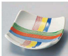
ネ100-069 糸巻き小鉢 11.5×3.8cm (磁) JPN 2,730円