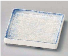
ホ100-199 ブルーパール松花堂角皿 10.3×10.3×1.8cm (磁) JPN 1,980円