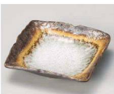
ト100-249 アカネ 縄目正角皿(小) 11×11×3cm (磁) JPN 1,000円