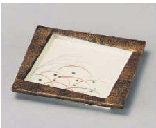
ミ100-049 秋草金タタキ正角皿 11.4×11.4×1.1cm (磁) JPN 2,600円