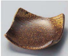
ミ100-189 手造り備前瀬上り皿 11.8×11.8×3.7cm (陶) JPN 1,850円