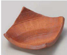
ミ100-179 火色くし目正角皿 11.5×11.5×4cm (陶) JPN 2,100円