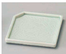
ト100-219 青磁笹角皿 11.6×11×1.2cm (磁) JPN 1,300円