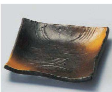
ア100-299 備前吹(松花堂兼用)角小皿 10.8×10.8×2.2cm (磁) JPN 720円