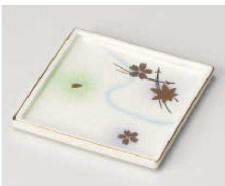
カ100-099 白吹竜田川角皿 11.2×11.2×1.1cm (磁) JPN 2,650円