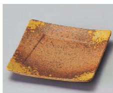
ホ100-269 備前吹き松花堂角皿 11.3×11.3×1.7cm (陶) JPN 1,350円