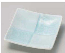
ネ100-229 正角市松皿 青白磁 11×11×2cm (磁) JPN 1,300円