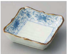
ツ100-159 染付花唐草輪花角小鉢 11.5×11.5×3.5cm (磁) JPN 1,800円