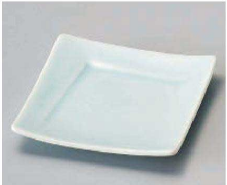
イ100-209 青白磁4.0角皿 11×11×2.2cm (磁) JPN 1,250円