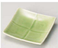
ト100-239 ヒスイ 市松正角皿 10×10×2.3cm (磁) JPN 1,300円