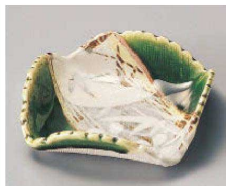
ミ100-019 織部山草花角鉢 11.2×11.2×3.5cm (磁) JPN 2,200円