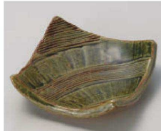
ミ100-169 オリベくし目正角皿 11.5×11.5×4cm (陶) JPN 2,100円