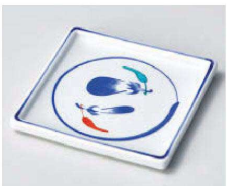
ツ100-109 茄子正角皿 11.3×11.3×1.1cm (磁) JPN 1,850円