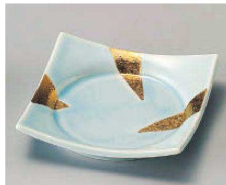
ミ100-119 青白金彩正角皿 11.5×11.5×2.3cm (磁) JPN 2,400円