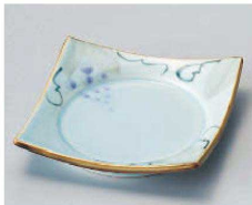
ミ100-129 手書きぶどう四方皿 11.4×11.4×2.3cm (磁) JPN 1,400円