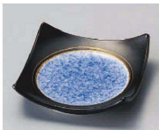
カ100-079 黒釉吹墨四方上り皿 11×11×3cm (磁) JPN 2,200円