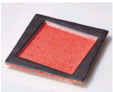
ト100-059 赤黒巻彫松花堂 11.2×11.2×1.2cm (磁) JPN 2,100円