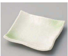
ホ100-309 グリーン吹くしめ正角皿 10.8×10.8×1.8cm (磁) JPN 720円