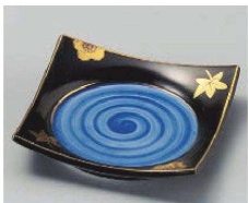
ミ100-089 黒釉春秋正角皿 11.5×11.5×2.3cm (磁) JPN 2,800円