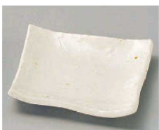
ア100-289 粉引(松花堂兼用)角小皿 10.8×10.8×2.2cm (磁) JPN 720円