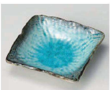
ト100-259 スカイ 縄目正角皿(小) 11×11×3cm (磁) JPN 900円