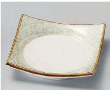
ミ100-149 淵サビグリーン吹正角皿 11.4×11.4×2.5cm (磁) JPN 1,400円