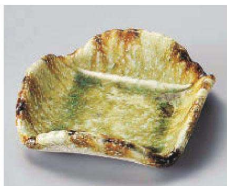
カ100-029 灰釉流四折鉢 11.3×11.3×3.3cm (磁) JPN 1,980円