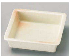
ホ100-279 ピンク吹松花堂角鉢 11.5×11.5×3.5cm (磁) JPN 830円