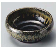
ツ103-049 天目流3.3丸鉢 φ11×4.3cm (陶) JPN 1,600円