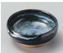
ツ103-039 青チタン3.3小鉢 φ11×4.3cm (陶) JPN 1,600円