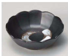
ネ103-019 黒マット刷毛十二角菊型皿 φ11.5×4.3cm (磁) JPN 1,700円