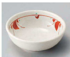
ア103-219 手描き赤絵花紋小鉢 φ11.5×4cm (磁) JPN 950円