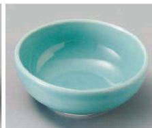
ネ103-209 青磁3.3ボール φ10.7×4.2cm (磁) JPN 1,000円