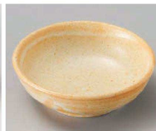
チ103-159 志野丸鉢 φ11×3.5cm (磁) JPN 1,200円