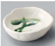
ツ103-089 白マット織部流し平鉢 φ11.5×10.9×4cm (磁) JPN 1,400円