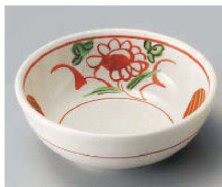
ア103-199 手描き赤絵万暦11.5cm鉢 φ11.5×4cm (磁) JPN 980円