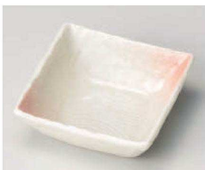
ト103-279 桜吹雪目 松花堂角鉢 10.5×10.5×4cm (磁) JPN 850円