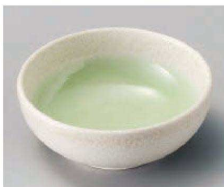
ネ103-189 若草3.3ボール φ10.7×4cm (磁) JPN 1,100円