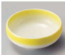
ツ103-099 イエロー鉄鉢型小鉢 φ10.8×4.4cm (磁) JPN 1,400円