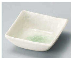
ア103-269 若草(松花堂兼用)角小鉢 10.5×10.5×3.9cm (磁) JPN 750円