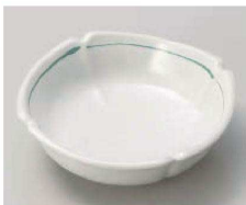
ロ103-139 白釉緑線 スミ切浅小鉢 11.8×11.8×3.5cm (磁) JPN 1,260円