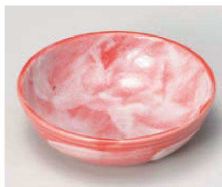
カ103-149 赤染丸鉢 φ11.5×3.4cm (磁) JPN 1,250円