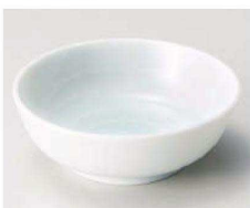
イ103-229 青白磁五輪小鉢 φ11.3×3.8cm (磁) JPN 880円