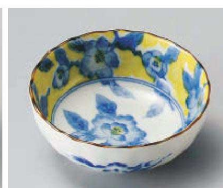
カ103-259 黄彩花紋菊型3.5鉢 φ10.5×4cm (磁) JPN 600円