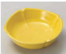
ロ103-129 黄 スミ切浅小鉢 11.8×11.8×3.5cm (磁) JPN 1,260円