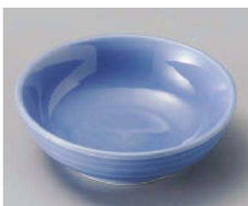
チ103-029 ブルー丸鉢(大) φ11×3.5cm (磁) JPN 1,480円