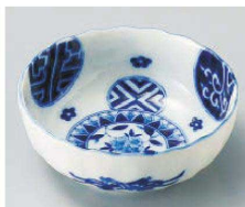
カ103-299 藍丸紋菊型3.5鉢 φ10.5×4.2cm (磁) JPN 580円