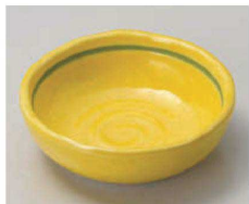
ア103-069 黄釉ボール(松花堂兼用) φ11.5×3.5cm (磁) JPN 1,450円