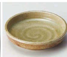
ツ103-059 美濃伊賀切立皿 φ11×2.8cm (陶) JPN 1,600円