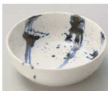
ホ103-249 ゴス流し松花堂鉢 φ10.5×3.7cm (磁) JPN 640円