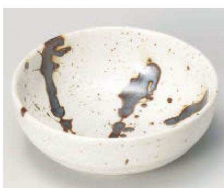
ホ103-239 サビ流し松花堂鉢 φ10.5×3.8cm (磁) JPN 640円