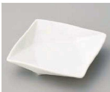
ホ103-289 折紙松花堂角皿 10.3×10.3×2cm (磁) JPN 1,100円