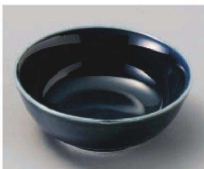
ミ103-179 青釉丸鉢 φ11.3×4.4cm (磁) JPN 1,180円