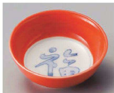
ツ103-119 柿釉見込福丸小鉢 φ11.2×4.3cm (磁) JPN 1,300円