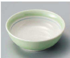
ミ103-079 ヒワ見込白丸小鉢 11.2×4.5cm (磁) JPN 1,400円