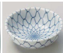
ア103-309 アミ丸小鉢(松花堂兼用) φ11.4×4cm (磁) JPN 500円

刺身鉢 向付 干代口 中鉢 高台小鉢 小鉢(組) 小付 喜付珍珠 珍珠 珍珠セット 松花堂 蓋向 円菓子碗 むし碗 ミニむし碗 天皿 とんすい