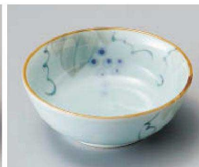
ミ103-109 手書きぶどう丸鉢 φ11.2×4.2cm (磁) JPN 1,350円