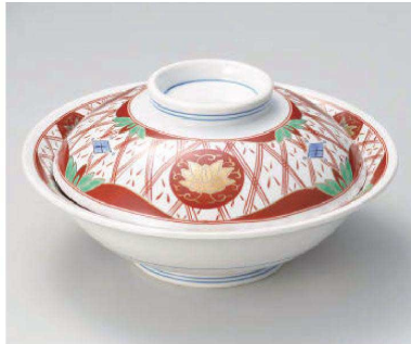
ツ105-019 錦華陽紋8.0骨むし φ24.3×12.5cm(磁) JPN 23,000円 ツ105-029 錦華陽紋7.0骨むし φ21.5×10cm(磁) JPN 14,500円