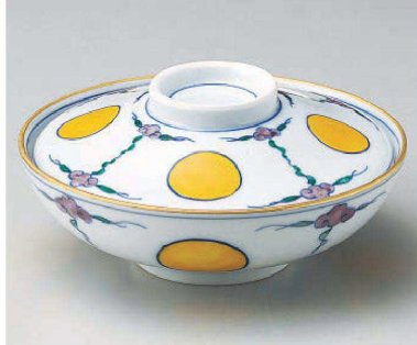
ミ105-069 瑠璃交趾紋平蓋向 φ15.3×7.8cm(磁) JPN 9,600円