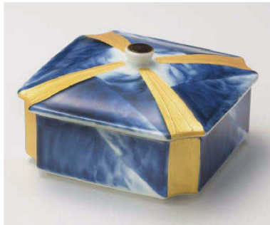
ツ105-099 ダミ金クロス 角蓋物 14.5×14.5×8.5cm(磁) JPN 8,000円