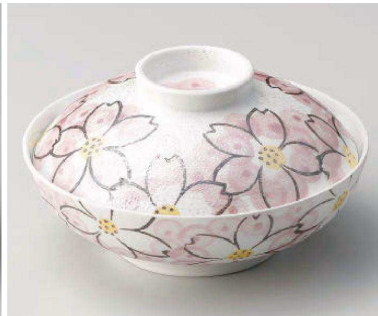
ロ105-119 ラスター華々 蓋向 13.4×7.6cm(強) JPN 7,340円