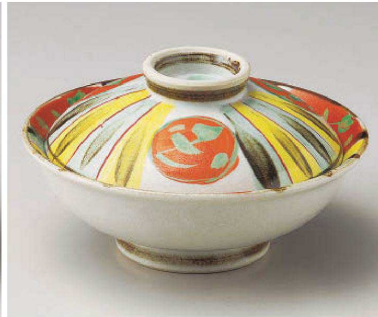
ツ105-049 十草赤丸紋7.0骨むし φ21.2×10cm(陶) JPN 8,800円 ツ105-059 十草赤丸紋平蓋向 16×8.7cm(陶) JPN 5,500円