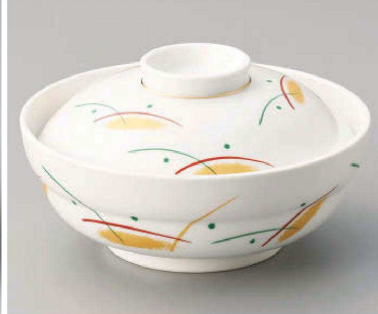
ロ105-089 赤絵むさしの蓋向 φ14.4×8cm(強) JPN 7,670円