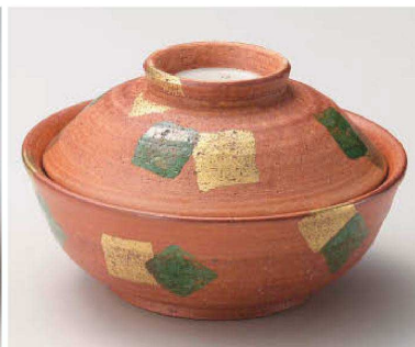
ネ105-149 金緑彩蓋向 φ13.3×8.3cm(陶) JPN 6,500円