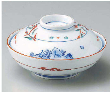
カ105-109 赤絵京山水蓋向 φ13.5×8.8cm(強) JPN 7,550円