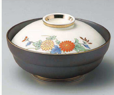
ア105-079 友禅菊蓋向 φ14.3×8cm(強) JPN 8,500円