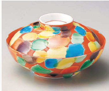
ト105-039 赤彩交趾蓋向 φ13.3×7.6cm(磁) JPN 11,000円