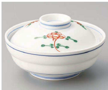
ア105-129 錦宝来蓋向 φ14.2×8cm・身φ14.2×5.5cm(強) JPN 7,150円