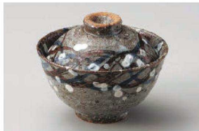
≡111-109 むさし野小蓋物 φ11×8.8cm(陶) JPN 3,450円