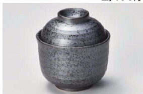
ト111-299 黒釉小蓋物 φ8.6×9cm(磁) JPN 1,000円