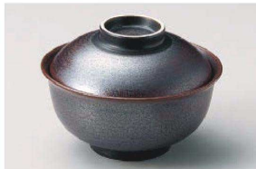
ホ111-159 鉄砂反型円菓子碗(大) φ13×8.5cm(磁) JPN 2,900円