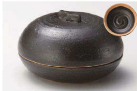
≡111-059 黒オリベ 手造り丸フタ物 12.5×7.5cm(陶) JPN 4,800円