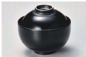
ア111-199 漆黒円菓子 φ10.1×8.8cm(磁) JPN 2,650円