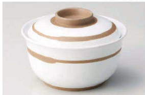
□111-189 茶筋煮物碗 φ12.7×8.4cm(陶) JPN 3,000円