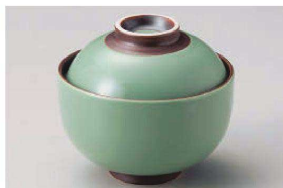
ト111-259 ヒスイ鑄巻円菓子碗(大) φ11×9.8cm(磁) JPN 2,400円