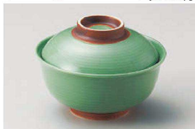
ト111-209 ヒスイ鑄巻反 円菓子碗(大) φ13×9.5cm(磁) JPN 2,600円