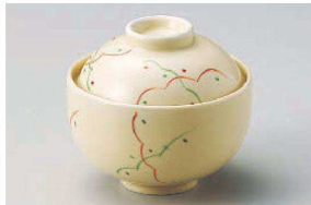
ホ111-079 美濃路円菓子碗 φ11×10cm(磁) JPN 4,200円