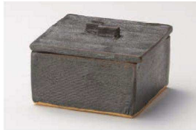
≡111-019 黒オリベ 正角蓋物 10.5×10.5×6.5cm(陶) JPN 6,000円