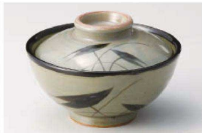
≡111-179 益子水草 煮物碗 φ13.8×9.5cm(陶) JPN 2,850円