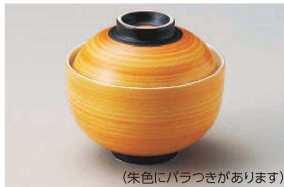
ホ111-129 外朱中白円菓子碗(大) φ11×10cm(磁) JPN(中は白色) 3,300円