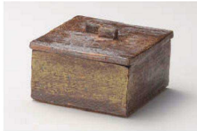
≡111-029 備前風 正角蓋物 10.5×10.5×6.5cm(陶) JPN 6,000円