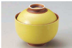
イ111-249 黄釉円菓子碗 10.9×10cm(磁) JPN 2,500円