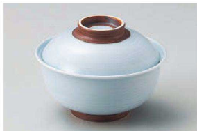
ト111-229 青白鑄巻反 円菓子碗(大) φ13×9.5cm(磁) JPN 2,600円