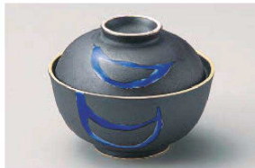
≡111-099 黒釉ルリ流し円菓子碗 φ11.4×9cm(磁) JPN 4,500円