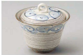
≡111-069 粉引削りゴス絵蓋物 φ11.5×10.2cm(陶) JPN 4,050円