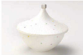
≡111-039 パール傘形円菓子碗 φ11×9cm(磁) JPN 4,400円