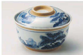
□111-149 古染山水円菓子碗 13×8.6cm(陶) JPN 3,090円