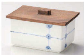
≡111-309 十字小花長角鉢 12.5×8.5×6.5cm(磁) JPN 3,850円