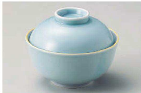
≡111-089 釉裏紅青磁円菓子碗 φ11.4×9cm(磁) JPN 4,500円