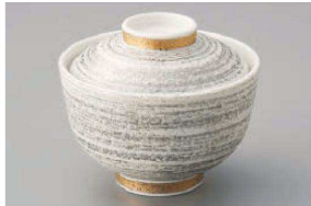
オ111-049 プラチナ刷毛小吸碗 φ8.5×7.5cm(磁) JPN 4,400円