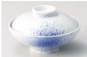
ネ111-119 吹墨姫碗 φ12.3×7.5cm(磁) JPN 3,800円