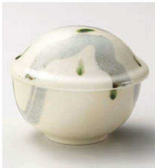
ミ114-099 呉須織部遊び 姫蓋物 10.5×9.5×8cm(強)JPN 2,600円