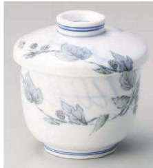
オ114-019 清彩つた京型むし碗 φ7.5×8.5cm(強)JPN 3,450円

刺身鉢 向付 干代口 中鉢 高台小鉢 小鉢(組) 小付 置付珍味 珍味 珍味セット 松花堂 蓋向 円菓子碗 むし碗 ミニむし碗 天 とんすい