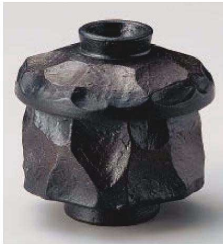
ト114-069 炭化土しのぎむし碗 φ8.5×8.5cm(陶)JPN 3,000円