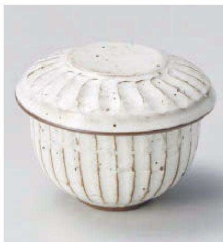
ト114-149 粉引ソギむし碗 φ7.5×6.8cm(陶)JPN 2,400円