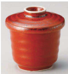
ト114-189 紅釉むし碗 φ9.3×9cm(強)JPN 2,300円