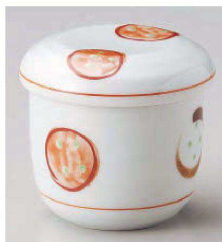
イ114-249 赤絵丸紋むし碗 φ7.7×8cm(200cc)(強)JPN 2,000円