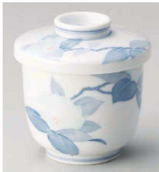
ホ114-089 清華むし碗 φ8×9cm(強)JPN 2,980円