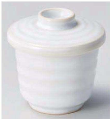
ト114-219 白雪むし碗 φ9.3×9cm(強)JPN 2,200円