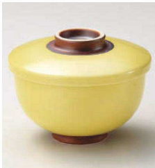
ト114-119 イエロー大むし碗 φ11×8.8cm(強)JPN 2,400円