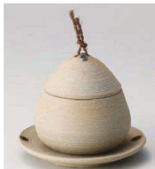
ネ114-129 焼締めくり蒸 小 φ8.5×8.8cm(150cc)(陶)JPN 2,500円 ネ114-139 焼締めくり蒸 小皿 φ10.7×1.5cm(陶)JPN 1,100円