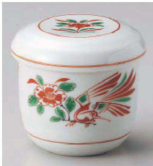
イ114-239 赤絵花鳥むし碗 φ7.7×8cm(200cc)(強)JPN 2,000円