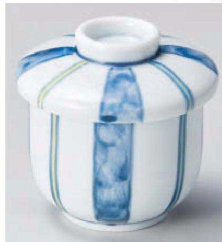
ア114-199 四方十草むし碗 φ8.2×9cm(約250cc)(強)JPN 2,200円