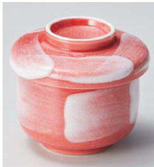
イ114-209 赤染むし碗 φ9.4×9.2cm(強)JPN 2,100円