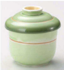
ロ114-109 緑彩金筋むし碗 φ7.2×6.5cm(160cc)(強)JPN 2,520円