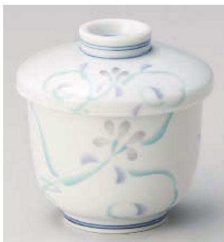
ミ114-159 ほたる草 京形むし碗 φ7.5×8.3cm(強)JPN 2,400円