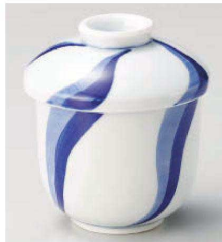
ネ114-079 流水長むし碗 φ7.2×9.2cm(強)JPN 3,500円