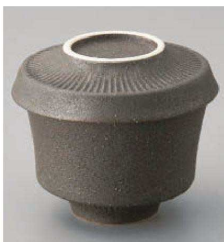
イ114-269 ラルゴむし碗 黒(蓋が皿になります) φ9.4×8cm(165cc)(強)JPN 1,800円