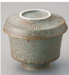
イ114-279 ラルゴむし碗 グレー(蓋が皿になります) φ9.4×8cm(165cc)(強)JPN 1,800円