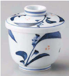
カ114-059 清里京型むし碗 7.5×8.4cm(強)JPN 3,100円