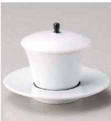
ミ114-169 強化黒巻むし 7.5×7.2cm(強)JPN 2,600円 ミ114-179 強化黒巻むし受け皿 12×1.9cm(強)JPN 1,200円