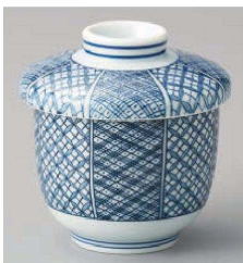
チ114-289 京祥瑞小むし碗 φ7.4×8.6cm(180cc)(強)JPN 1,900円