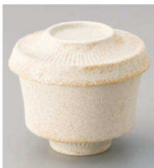
イ114-259 ラルゴむし碗 白(蓋が皿になります) φ9.4×8cm(165cc)(強)JPN 1,800円