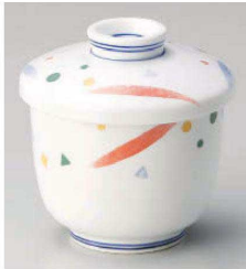
オ114-029 はなやき京型むし碗(組) φ7.5×8.5cm(強)JPN 3,350円