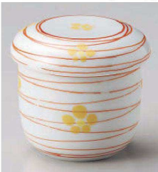
イ114-229 赤絵乱線梅むし碗 φ7.7×8cm(200cc)(強)JPN 2,000円