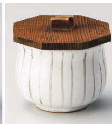
ネ118-059 十草むし碗 小身 φ7.5×5.8cm (磁) JPN 1,620円 ネ118-069 十草むし碗 小 木蓋 φ8.2×1.5cm JPN 380円