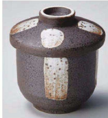
オ118-169 唐津刷毛目小むし碗 φ7.4×9cm (磁) JPN 1,250円