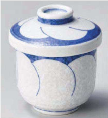
オ118-159 淡雪梅割小むし碗 φ7.4×9.2cm (磁) JPN 1,250円