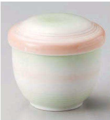
カ118-109 白磁二色吹き(中)むし碗 7.2×7.5cm (磁) JPN 1,350円