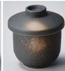
オ118-129 黒伊賀小むし碗 φ7.4×9.2cm (磁) JPN 1,300円