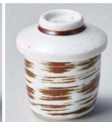
ネ118-279 茶刷毛ミニむし碗 φ6.8×6.5cm (150cc) (磁) JPN 980円