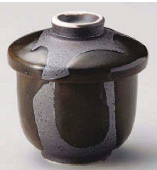
オ118-199 織部流しミニむし碗 φ8×8cm (磁) JPN 1,200円