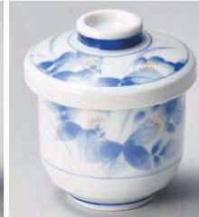
オ118-179 花情小むし碗 φ7.4×9.2cm (磁) JPN 1,200円