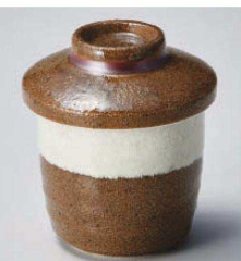
ネ118-249 渋白ブラウンミニむし碗 φ6.8×6.5cm (150cc) (磁) JPN 980円