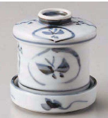
ロ118-089 丸紋蝶むし碗 φ7×8cm (受皿) (磁) JPN 1,380円 ロ118-099 丸紋焼むし受け皿 φ8.4×2.2cm (磁) JPN 600円