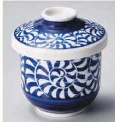
オ118-139 夕コ唐草小むし碗 φ7.4×9.2cm (磁) JPN 1,250円