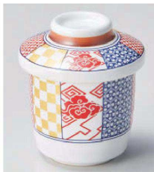
ネ118-049 いろどり錦ミニむし碗 φ6.8×6.5cm (150cc) (磁) JPN 1,700円