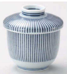
チ118-029 京十草小むし碗 φ7.4×8.7cm (185cc) (磁) JPN 1,900円