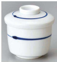
チ118-019 呉須筋ミニ蒸碗 φ6.9×7.5cm (140cc) (磁) JPN 1,900円