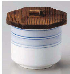
ア118-079 駒筋小むし φ6.8×7.5cm (強) JPN 1,750円