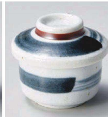
ネ118-229 黒刷毛梨地ミニミニ蓋物 φ6.8×5cm (120cc) (磁) JPN 900円