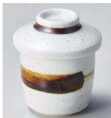
ネ118-239 粉引茶刷毛ミニむし碗 φ6.8×6.5cm (150cc) (磁) JPN 980円