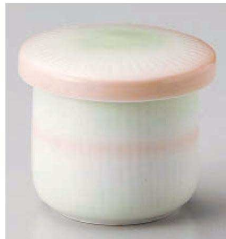
ホ118-189 あけぼのミニむし碗 φ6.5×6.5cm (磁) JPN 1,300円