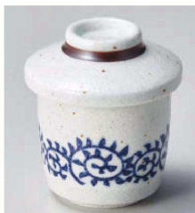
ネ118-269 呉須唐草梨地ミニむし碗 φ6.8×6.5cm (150cc) (磁) JPN 980円