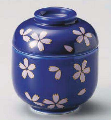
オ118-149 藍染桜ふぶきミニむし碗 φ7.1×8cm (強) JPN 3,850円