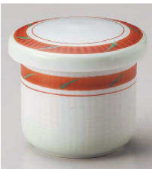
ミ118-039 細点字ミニむし碗 φ6.6×6.9cm (磁) JPN 1,700円