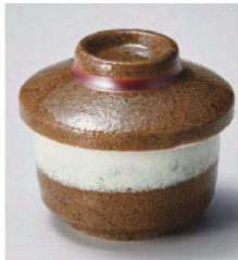
ネ118-219 渋白ブラウンミニミニ蓋物 φ6.8×5cm (120cc) (磁) JPN 900円