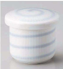
ホ118-209 白磁洞ミニむし碗 φ6.5×6.5cm (磁) JPN 1,150円