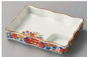
イ150-139 赤絵牡丹波仕切皿 15.5×12×3cm (磁) JPN 1,950円