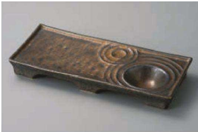
タ150-029 金結晶波紋千代口付長角皿 27×11.7×3cm (磁) JPN 2,800円