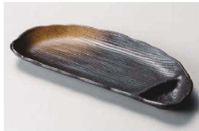
ア150-059 黒茶吹き半月仕切皿 28×12×27cm (磁) JPN 2,750円