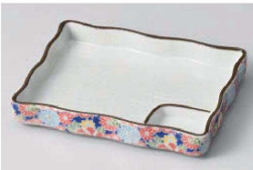
イ150-159 四季友禅長角仕切 大 18.3×14.3×3cm (磁) JPN 1,950円