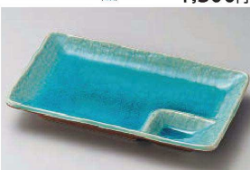
オ150-219 ヒスイ仕切皿 21×13.5cm (磁) JPN 1,900円