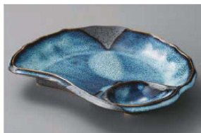
ヤ150-239 清流貝型仕切皿 23×17×4cm (磁) JPN 1,900円