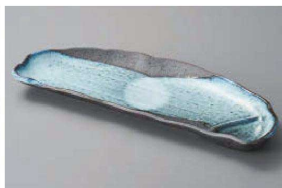
ヤ150-279 清流寿司皿 30.5×12×2.7cm (磁) JPN 1,700円