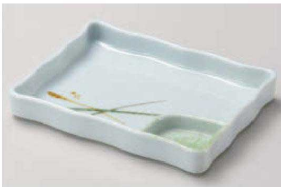
ホ150-109 美濃路仕切皿(大) 17.5×14×2.4cm (磁) JPN 2,200円