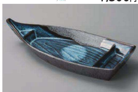
ヤ150-229 清流舟型皿 26.3×11.5×4.8cm (磁) JPN 1,900円