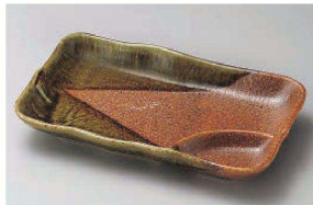
タ150-099 美濃伊賀仕切皿 21.2×12.9×3.4cm (磁) JPN 2,200円