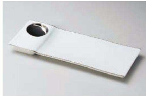
オ150-019 プラチナ珍珠付突出皿 25.7×10.1×1.6cm (磁) JPN 4,650円