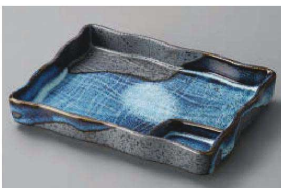
ヤ150-249 清流長角仕切皿(大) 17.8×14×3cm (磁) JPN 1,800円