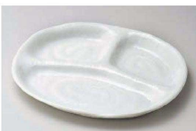
ミ150-209 白釉三ツ切10時仕切皿 25×21.3×2.2cm (磁) JPN 2,250円