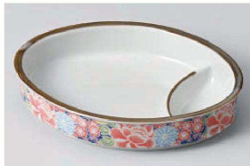
イ150-129 四季友禅小判型仕切 18.8×14×3.8cm (磁) JPN 1,950円