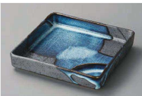
ヤ150-269 清流正角仕切皿 16.5×16.5×3.2cm (磁) JPN 1,800円