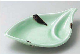
ト150-079 緑葉千代口付皿 23×13.5×4.5cm (磁) JPN 2,700円