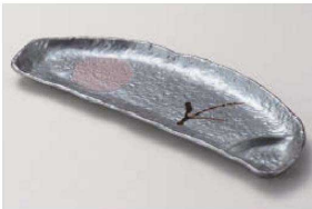
ホ150-069 月あかり仕切長多用皿 31.3×12cm (陶) JPN 2,700円