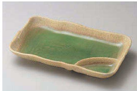
イ150-089 ヒワ釉古代仕切皿 21.5×13×3cm (磁) JPN 2,450円