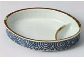
イ150-119 タコ唐草小判型仕切 18.8×14×3.8cm (磁) JPN 1,950円