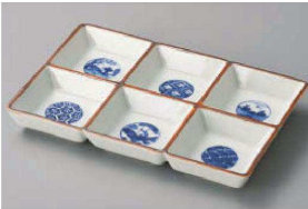
ネ150-039 六つ仕切丸紋山水薬味皿 18.6×12.5×2.2cm (磁) JPN 4,400円