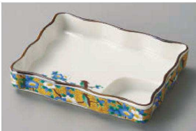
イ150-149 黄花鳥波仕切皿 15.5×12×3cm (磁) JPN 1,950円