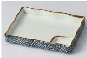
イ150-179 タコ唐草長角仕切 大 18.3×14.3×3cm (磁) JPN 1,950円