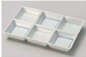
カ150-049 呉須線六ツ仕切り皿 18.9×12.7×2.3cm (磁) JPN 3,050円