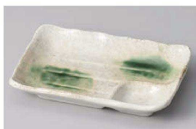
ヤ151-139 白織部流し16.5cm 仕切皿 16.7×11.5×2.8cm (磁) JPN 950円