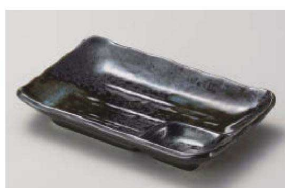
イ151-179 黒釉かすれ吹 仕切皿(小) 17×11×2.7cm (磁) JPN 980円