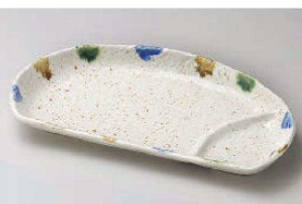
タ151-129 三彩半月仕切皿 23.7×12.7×3cm (陶) JPN 1,400円