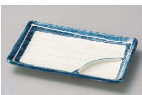
ロ151-189 一珍測ライン6.0仕切皿 17.2×11.2×1.2cm (磁) JPN 990円