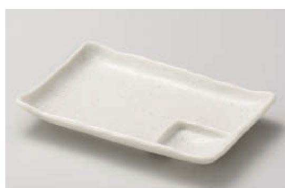
ヤ151-059 白砂 6.0仕切皿 17×12×2.5cm (磁) (美濃焼) JPN 1,600円