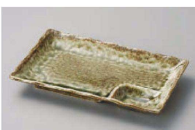
ツ151-229 グリーンイラボ7.0仕切皿 21.5×13.4×2.8cm (磁) JPN 1,000円