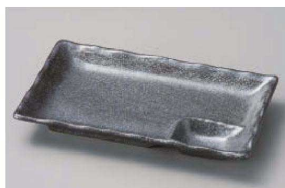
ツ151-019 いぶし黒7.0仕切皿 21.5×13.4×2.8cm (磁) JPN 1,000円