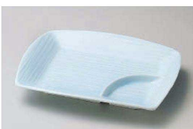
ア151-069 青白磁千代口5.0パーティー皿 18.3×13.8×2.7cm (磁) JPN 1,600円