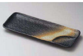
ト151-039 黒吹仕切付きさんま皿 30.2×12×2.3cm (陶) JPN 1,650円