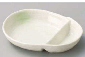
ホ151-119 グリーン吹だるま型仕切皿 17.2×13.2×3.2cm (磁) JPN 1,200円