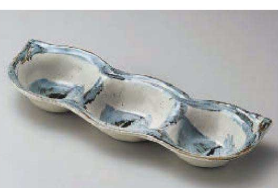
ミ151-249 藍染そら豆3品盛り皿 27.1×9.5×3.5cm (磁) JPN 1,280円