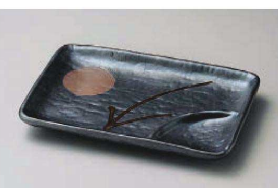
ホ151-079 月あかり6.0仕切皿 17.5×12cm (陶) JPN 1,680円