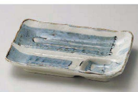
オ151-159 藍染仕切付刺身皿(小) 16.7×11.2×2.7cm (磁) JPN 1,000円