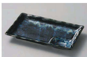
ツ151-219 ナマコ釉7.0仕切皿 21.5×13.4×2.8cm (磁) JPN 1,000円