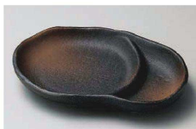
カ151-099 黒伊賀仕切皿 17.2×12.2×2.5cm (磁) JPN 1,300円