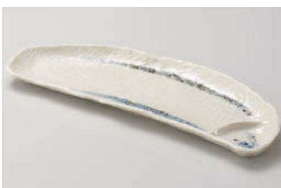
ト151-029 半月仕切付多用皿 31.5×12×2.5cm (陶) JPN 1,650円