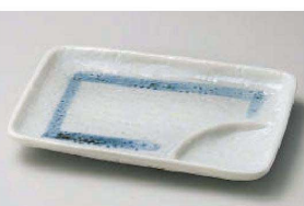
ト151-199 おふけ6.0仕切皿 17×12×2cm (陶) JPN 850円