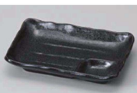
ミ151-209 黒釉6.0仕切皿 16.8×11.2×2.8cm (磁) JPN 920円