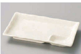
ツ151-149 白水晶7.0仕切皿 21.5×13.4×2.8cm (磁) JPN 1,000円