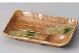
ヤ151-169 伊賀織部16.5cm 仕切皿 16.7×11.5×2.8cm (磁) JPN 950円