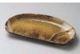
タ151-089 黄河半月仕切皿 23.7×12.7×3cm (陶) JPN 1,400円