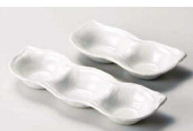
ミ151-259 白釉そら豆3品盛り皿 27.1×9.5×3.5cm (磁) JPN 1,280円