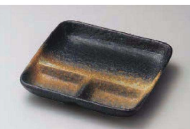
ア151-049 備前風正角仕切皿 17.8×17×3.3cm (陶) JPN 1,750円