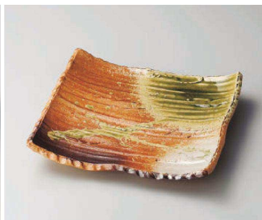
×159-039 古信楽10.0足付そぎ長角皿 29.5×25.5×5cm (陶) JPN 9,000円 ×159-049 古信楽8.0足付そぎ長角皿 24×19.5×3cm (陶) JPN 6,800円