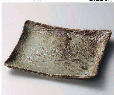
ネ159-129 越前角大皿 29.7×24.7×4.3cm (磁) JPN 7,500円