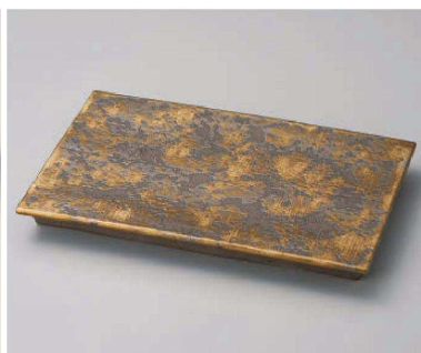
オ159-149 GOLDルール皿 大 31×19.8×3cm (陶) JPN 7,500円