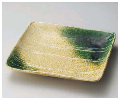
ユ159-119 黄瀬戸織部吹長角大皿 30.5×26.5×5cm (陶) JPN 8,500円