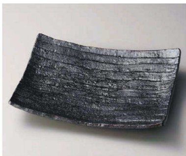
カ159-029 南蛮長角盛皿(大) 35×27.3×5cm (磁) JPN 9,350円