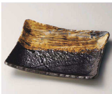
ネ159-139 流木角大皿 30.5×24.5×5cm (磁) JPN 7,500円