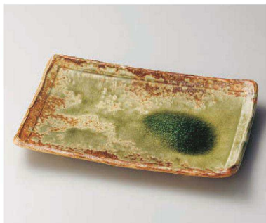
×159-069 灰釉足付長角皿 32×21×4cm (陶) JPN 8,300円