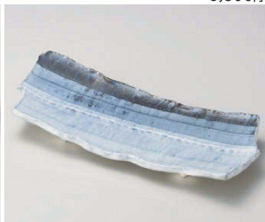
カ159-079 呉須線段尺二皿 38×16×4.7cm (磁) JPN 7,800円