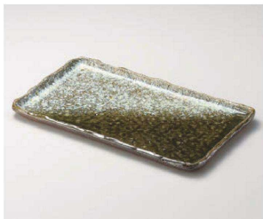
×159-059 ビードロ窯変13.3長角皿 40×24×2.5cm (陶) (信楽焼) JPN 10,000円