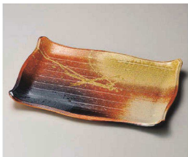
×159-019 古信楽12.0長角皿 35.5×24.5×3cm (陶) JPN 9,500円