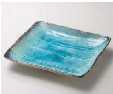
ト159-109 スカイ浜付角大皿 30.5×27×5cm (磁) JPN 8,250円