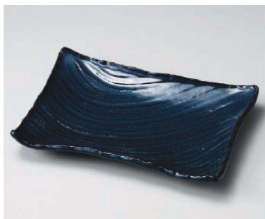
イ159-089 紺ナマコ31角皿 31×21×4cm (磁) JPN 8,700円