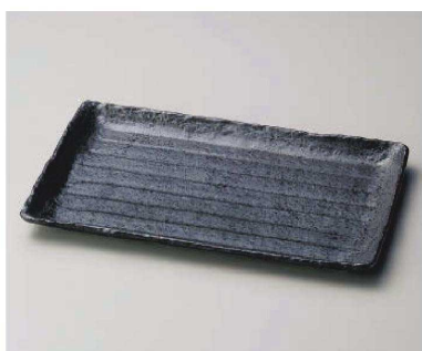
ト163-079 黒釉NEWホッケ皿 33.5×21×2cm (磁) JPN