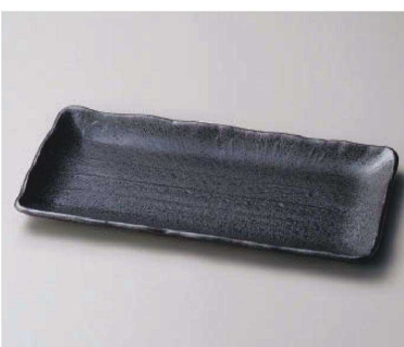
ト163-129 南蛮ほっけ皿 33×16.5×2.4cm (磁) JPN