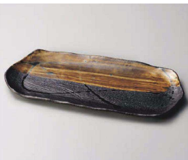
ネ163-029 流木長角皿 大 35.8×16.3×2cm (磁) JPN