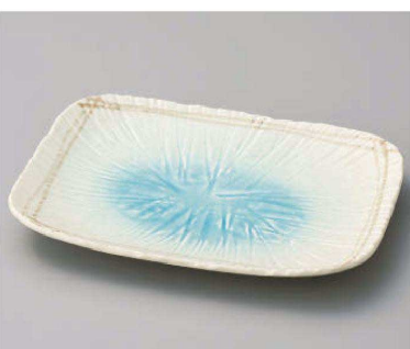
ホ163-119 しずく彫十草型角型盛皿 25.9×20×2.5cm (磁) JPN