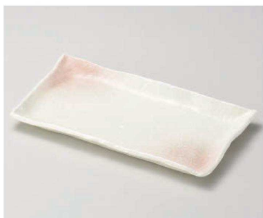
ト163-049 桜吹長角皿 31.2×16.7×2.5cm (磁) JPN