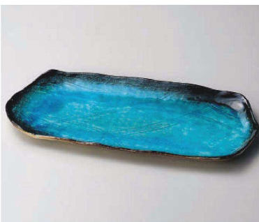
ト163-039 スカイホッケ皿 36.5×16.5×2.5cm (磁) JPN