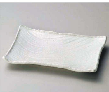
ユ163-059 雪粉引26cm角皿 26×17.5×3.5cm (磁) JPN