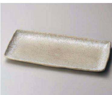
ハ163-099 淡雪白ほっけ皿 33.8×15.5×2.5cm (磁) JPN