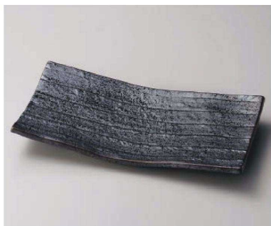
カ163-019 南蛮まな板皿 31×15.8×3.4cm (磁) JPN