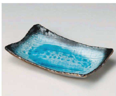
ト163-109 スカイ手作り長角皿(大) 26.5×16.5×4.5cm (磁) JPN