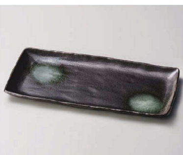
ハ163-089 鉄砂ほっけ皿 33.8×15.5×2.5cm (磁) JPN